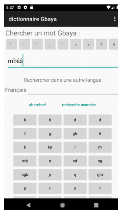
Figure 1: Page principale