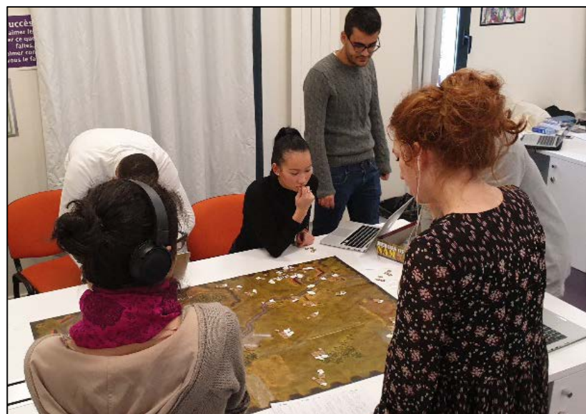
Figure 3. Scénario final. Seuls les opérationnels des deux équipes MOA sont présents autour de la carte des combats.