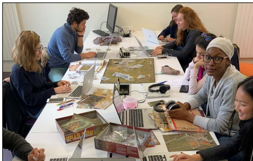
Figure 1. Cartes, pions, règles, etc. Les étudiant·e·s des maîtrises d'ouvrage font connaissance avec le wargame et l'environnement uchronique qu'il simule (début d'une 3 ème guerre mondiale en 1985).

Le wargame sur table de type hex & counters (Cf. Figure 1) que nous avons utilisé est Heroes Against the Red Star 4 de la société américaine Lock'n Load Publishing. Il fait partie de la série Lock'n Load Tactical System, c'est-à-dire qu'il se situe aux plus bas échelons de la hiérarchie militaire (un pion représente un groupe de combat d'une dizaine de soldats, une arme de soutien ou un véhicule). Notre choix est dû notamment à la simplicité (relative) de ses règles, à sa dimension interarmes (regroupement de multiples spécialités au sein d'un même commandement) et au niveau technologique des unités militaires qui correspond globalement à une armée moderne n'ayant pas entamé sa transformation numérique. Dans ce contexte, nous pouvons faire un parallèle avec un cas particulièrement saillant : la numérisation des forces terrestres (NFT). Il s'agit de la transformation numérique des unités combattantes de l'armée de Terre française. Débutée dans les années 90 dans un contexte extrêmement technodéterministe, elle est particulièrement bien documentée et en cours de finalisation avec la mise en œuvre de l'infovalorisation (Lépinard, 2013 ; Duchemin et al., 2017). À noter que le contexte militaire réel n'est donné que lors de la dernière journée de débriefing.