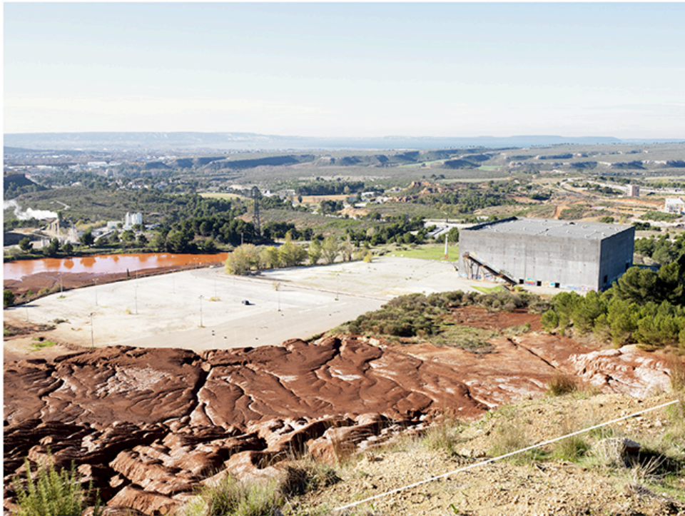
Boues rouges et Stadium, Vitrrolles, 12h10, 12 mars 2012

permettent de présenter l'OPP, mettant alors en œuvre le postulat de l'expérience marchée, à l'origine de l'initiative du GR2013. La photographie devenant un vecteur de découverte in situ du paysage, il s'agit de faire connaître et de sensibiliser, mais également d'impliquer les habitants et usagers. En effet, des cent images de la série, soixante-dix 20 sont attribuées à des personnes souhaitant « adopter un paysage ». Un tirage leur est confié, présentant au recto l'image et au verso sa fiche technique, et elles s'engagent à reconduire l'image pendant dix ans 21 en vue de sa mise en ligne. Ces adoptants sont formés à la reconduction lors d'événements menés sur le GR par MP2013 22 et occasionnellement encore aujourd'hui réunis par les photographes. Si les soixante-dix points de vue proposés n'ont pas été adoptés, un groupe se fédère, dont il s'agirait de trouver les modalités de fonctionnement comme nouveau groupe de réflexion.