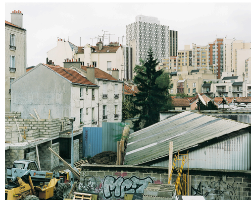
Itinéraire n° 9, ville de Montreuil © Anne Favret et Patrick Manez, OPNP.

Fig. 11. Rue François Debergue (09 005 01), février 1997.