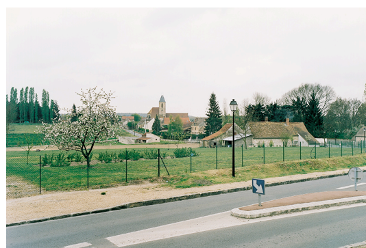
Fig. 07. Rampe de la mairie vers la place (09 034 01), octobre 1997.

Itinéraire n° 9, ville de Montreuil