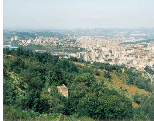
Itinéraire n° 1, Parc naturel régional du Pilat

Fig. 1. Condrieu (69), vue sur le Rhône et abords (01000101), octobre 1992.