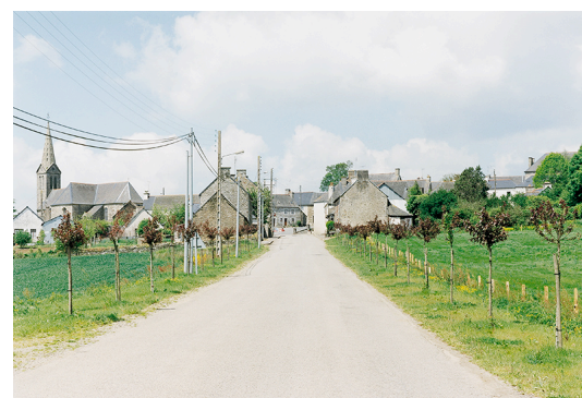
Fig. 09. Aiglun Mallemoisson (10 030 01), octobre 1996.

Itinéraire n° 10, vallée des Duyes et de la Bléone (Dreal Paca)