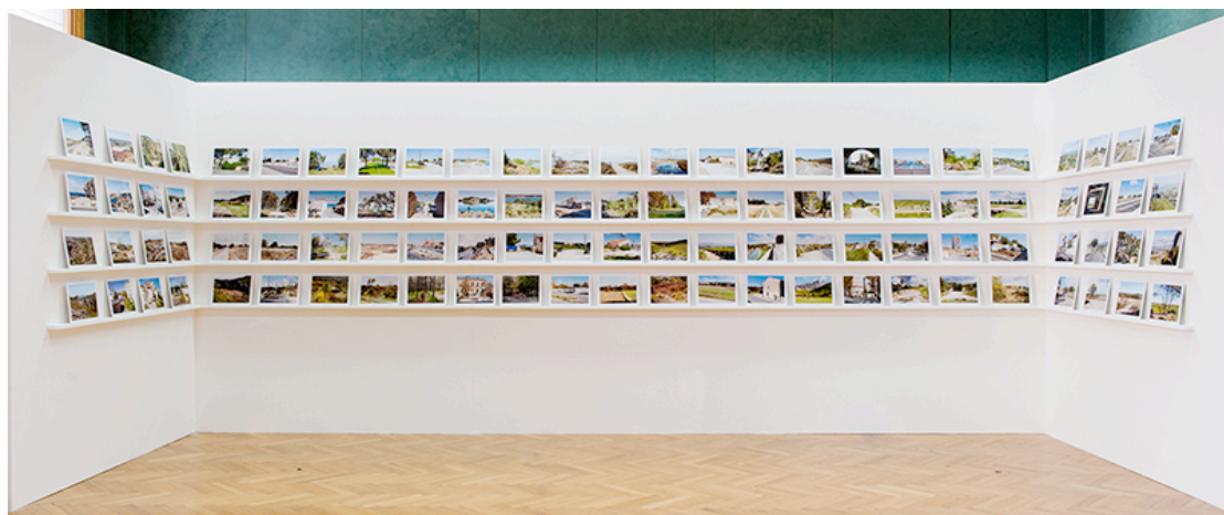
OPP depuis le GR2013 © Bertrand Stofleth et Geoffroy Mathieu