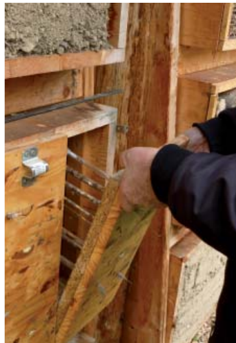
En haut, les tiges de bambou attirent de nombreuses osmies. Ci-dessus, Une bûche dont les trous sont operculés - Clichés Charlotte Visage - À droite un casier pédagogique permettant d'observer le développement des abeilles - Cliché Nicolas Césard

dénombrer près de 1 000 espèces en France dont l'Abeille domestique, 2 000 espèces en Europe et près de 20 000 sont connues dans le monde. Indispensables butineuses, leur richesse spécifique est la clé d'une pollinisation efficace. Or, leur déclin aura des conséquences importantes sur la biosphère et la vie des hommes, un tiers de notre alimentation et les trois quarts des espèces cultivées étant dépendantes de la pollinisation par les insectes. Le choix des villes pour le programme n'est pas anodin. Les milieux urbains et péri-urbains présentent de nombreux atouts pour les abeilles : on y trouve moins de pesticides que dans les zones d'agriculture intensive conventionnelle, la température qui y est légèrement plus élevée bénéficie aux abeilles pour la plupart thermophiles, les parcs urbains offrent une floraison abon-