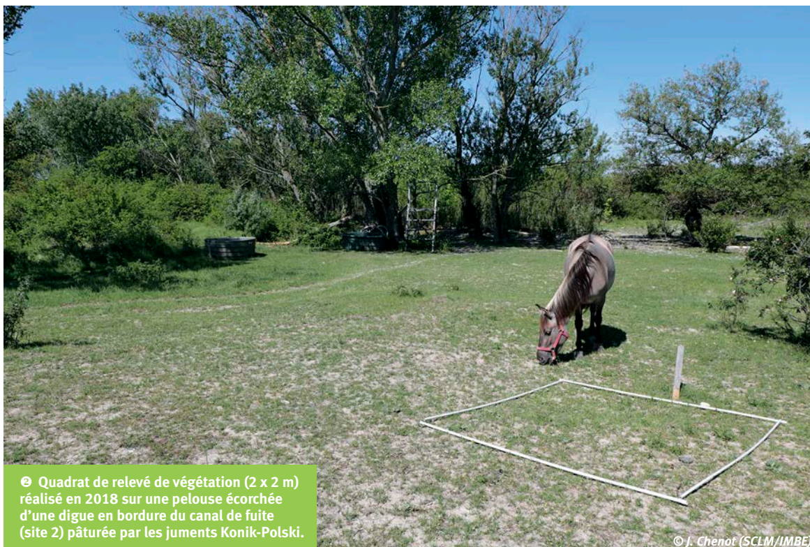
④ Quadrat de relevé de végétation (2 x 2 m) réalisé en 2018 sur une pelouse écorchée d'une digue en bordure du canal de fuite (site 2) pâturée par les juments Konik-Polski.