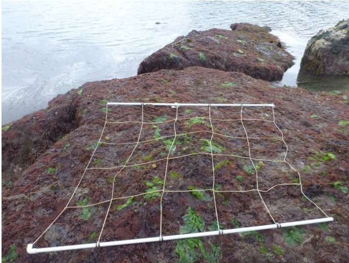
Figure 2 : Le point DCE/REBENT Bifurcaria bifurcata /Algues rouges n° 1 sur le site de Bréhat.