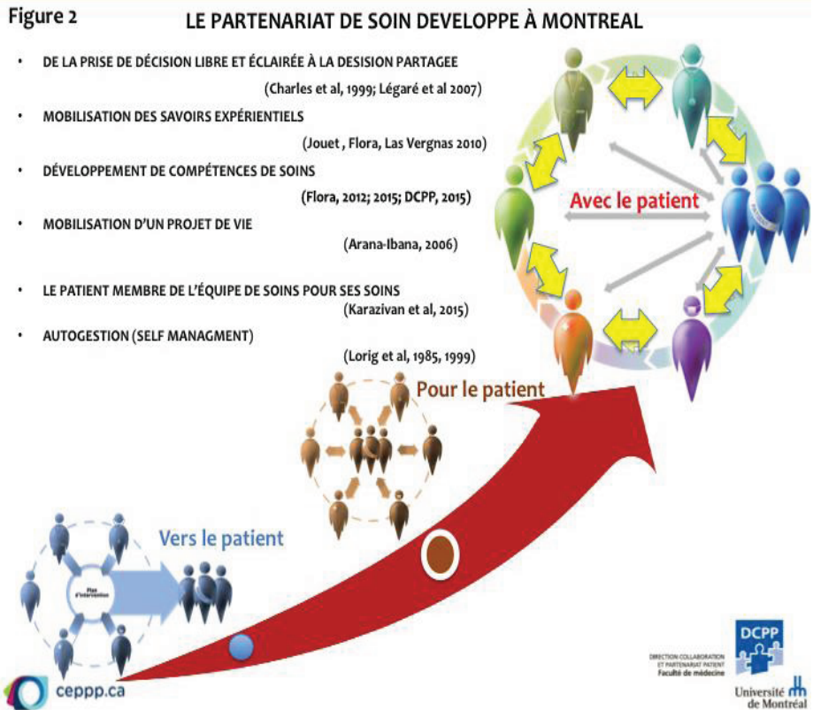
Figure 2 – « Le partenariat de soin développé à Montréal », (DCPP, Université de Montréal).

l'Université de Montréal a trouvé les clés de cette expérience à des fins de reproductibilité du processus. Le partenariat met davantage l'accent sur le partage de pouvoir et de responsabilité entre patients et professionnels (Ghadiri, Flora & Pomey, 2017), un passage du « soigner pour » au « soigner avec », (Figure 2) ci-dessous.