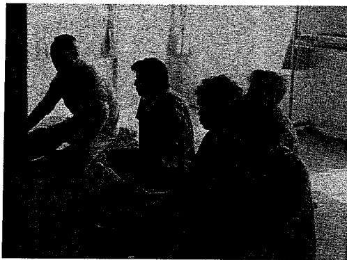
会津若松市の仮設住宅（2013年5月）（筆者撮影）