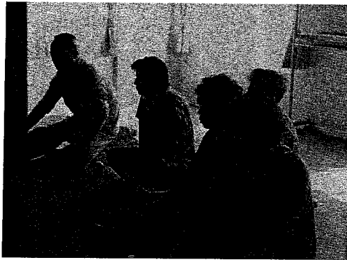
会津若松市の仮設住宅（2013年5月）