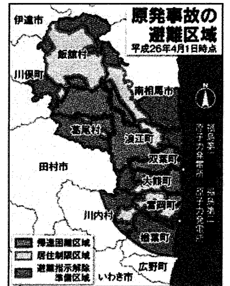
2014年4月1日時点の避難区域の状況(12)

こうした帰還を呼びかける政策は、二〇一三年五月末になされた一部区域の開放に帰着した。二〇一一年四月、政府は双葉町のほか八つの地方自治体を含む二〇キロ圏内を避難指示地域に設定した。その区域の全体が再編成され、「避難指示解除準備区域」(放射線量は二〇ミリシーベルト以下)、「帰還困難区域」(五〇ミリシーベルト)に見なおされた。原子力発電所周辺の九つの地方自治体を含む特別警戒区域はすべてなくなるようになった(11)。この施策の影響を受ける住民は七万六四二〇人である。