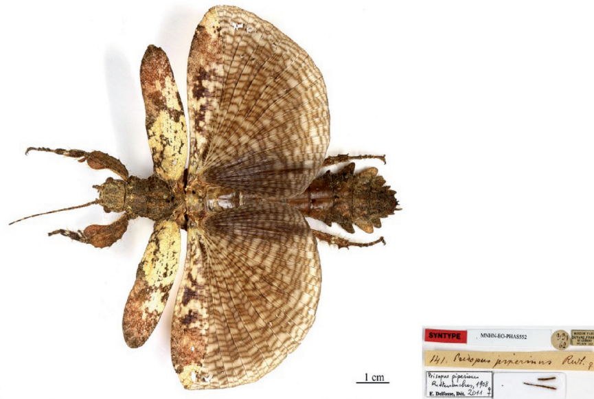
Syntype de Prisopus piperinus Redtenbacher, 1906 (MNHN-EO-PHAS552)