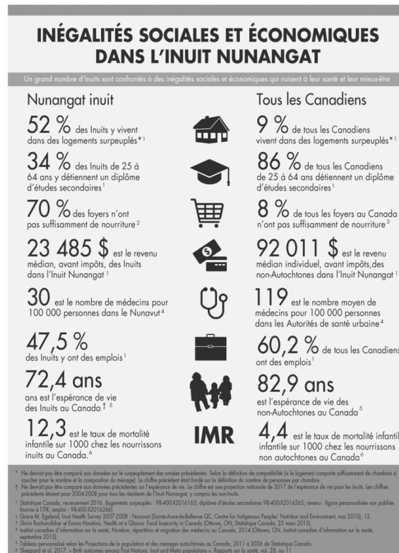
Figure 1. Indicateurs socio-économiques clés entre Inuit Nunangat et les moyennes canadiennes (©Atlas des peuples autochtones du Canada, consulté en 2019) États-Unis/Alaska