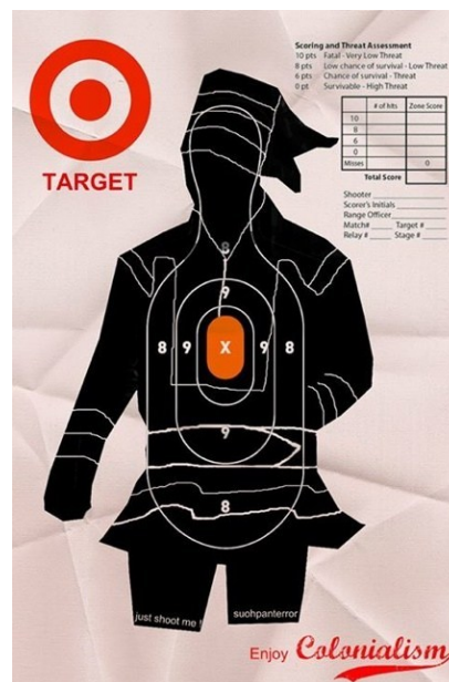
Figure 2- affiche créée pour le camp de résistance artistique de Gállok, 2013, Suohpanterror. La silhouette noire dessine les contours du vêtement traditionnel saami et la graphie de « enjoy Colonialism » reprend les codes typographiques de la marque Coca-Cola pour insister sur l'association entre idéologie colonialiste et néolibéralisme. (©We make Money not Art, 2015).