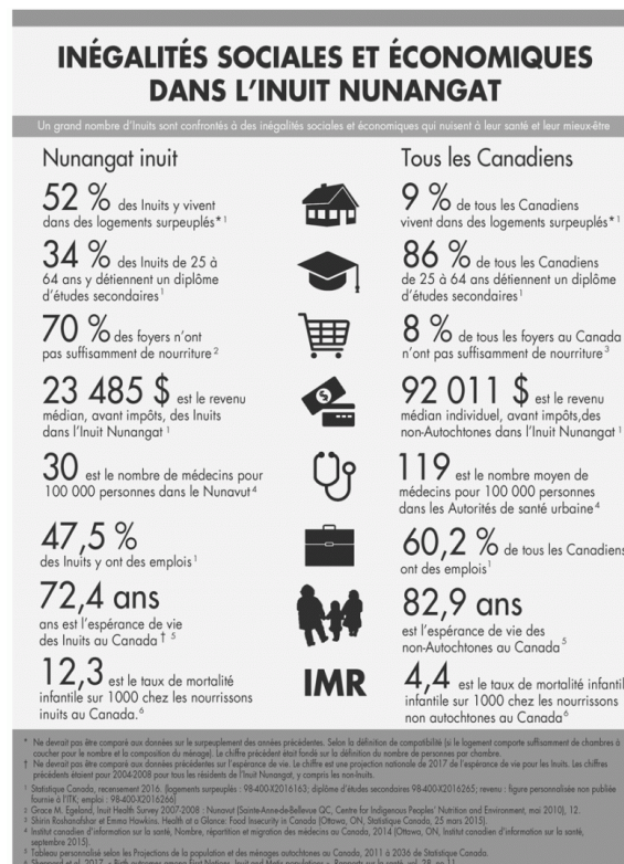
Figure 1. Indicateurs socio-économiques clés entre Inuit Nunangat et les moyennes canadiennes (©Atlas des peuples autochtones du Canada, consulté en 2019) États-Unis/Alaska