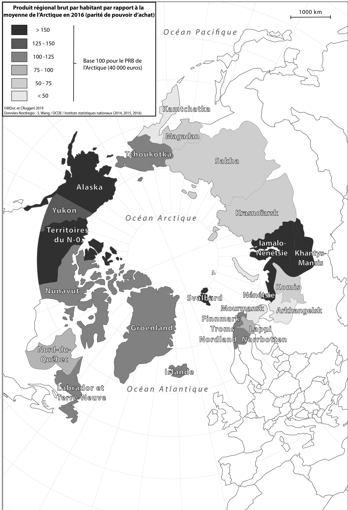
Carte 3. Produit régional brut par habitant par rapport à la moyenne de l'Arctique en 2016. Cet indicateur permet de mettre en valeur de fortes disparités entre régions dans la production de richesses.