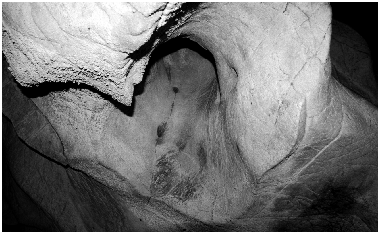
Fig. 6. El Castillo (Cantabrie) : Main dans une conque.

semblent plonger. Dans la grotte d'El Castillo, une main négative a été placée dans une conque profonde formée par un gros pendant rocheux. La position était pourtant particulièrement inconfortable : la personne a dû introduire son bras plié dans ce creux et projeter le colorant par le bas pour obtenir une image de sa main dont les doigts étaient dirigés vers le bas (fig. 6). Dans la même grotte, une autre main a été apposée entre un pendant rocheux et la paroi en vue de réaliser une main rouge qui semble indiquer l'espace créé par les deux plans ou y pénétrer. Dans ces cas, plutôt que de contribuer à la mise en forme de la figure, comme c'est si souvent le cas pour les représentations animales, la paroi apparaît comme un support inerte, non sans intervenir à l'occasion comme élément participant 75 .