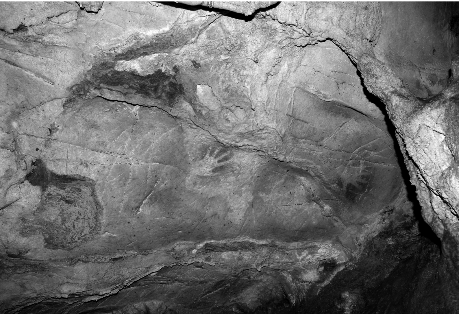
Fig. 1. El Castillo (Cantabrie) : Mains négatives du Plafond des Mains