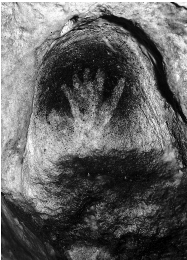
Fig. 4. Gargas (Hautes-Pyrénées), Salle I, Ensemble 12.