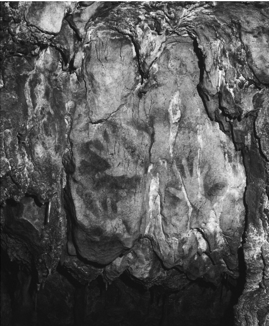
Fig. 7. La Garma (Cantabrie) : Mains négatives

graphique nous apporte une indication précieuse sur la ou les parties significatives de la grotte. On l'oublie trop souvent, cavité physique et espace symbolique ne coïncident pas nécessairement. Les quelque 850 m de couloirs, de salles et de recoins de la grotte cantabrique d'El Castillo ont été accessibles à toutes les périodes de la longue préhistoire paléolithique. Pourtant, les mains négatives se cantonnent à une partie limitée du réseau. Cette indifférence vis-à-vis de parties néanmoins accessibles au détriment d'autres souligne évidemment la volonté d'un choix. Elle rappelle que les différents espaces de la grotte ne sont pas équivalents pour les visiteurs paléolithiques. Certaines mains ponctuent les parois de couloirs ou de zones d'accès de la grotte : elles devaient scander le cheminement en marquant les zones de passage obligé (Galerie des Disques ou Galerie des Mains à El Castillo). D'autres sont regroupées en ensembles et correspondaient sans doute à des endroits