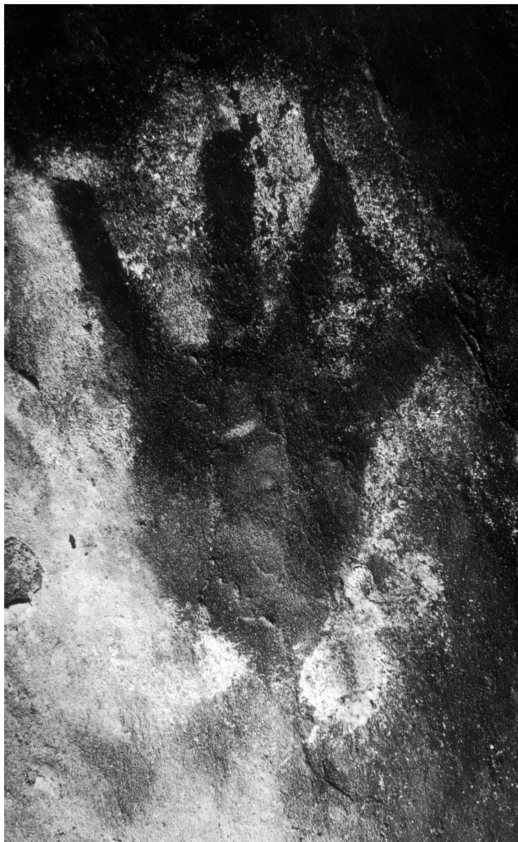
Fig. 3. Gargas (Hautes-Pyrénées) : Main blanche du Laminoir des Crevasses . Le pouce est oblitéré.

La conclusion vaut d'ailleurs pour les mains négatives du site voisin de Tibiran, dont la peinture est composée d'argile ne contenant que 20 % d'oxyde de fer et beaucoup d'impuretés 33 . Il est évidemment difficile d'admettre que ces mains aient été faites par les mêmes personnes, dans la mesure où l'ocre employée à Tibiran est sans relation avec l'hématite microcristallisée des mains rouges de la Salle I de Gargas, ni avec celle, très pure, de la Salle II de la même grotte. La situation n'est pas différente dans la Grande Grotte d'Arcy-sur-Cure, où des prélèvements effectués sur 4 mains négatives indiquent l'utilisation de deux préparations distinctes au moins 34 .