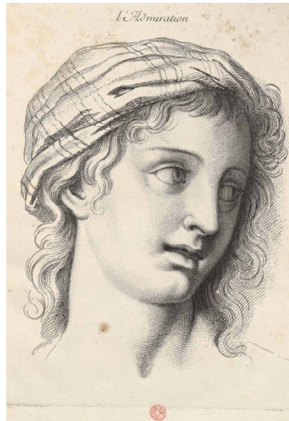
3. kép. Charles Le Brun: A csodálkozás. 1727.

Le Brun rajzai láttán a nézőnek az a benyomása, mintha ezek a figurák mozdulatlanná merevíténék a lélek szenvedélyeit, és valódi érzelmeket kifejező, „élő” arcok helyett pusztá álarcok volnának. Ha a klasszicista kor festészetteoretikusai szerint a képalakok arcának jól olvashatóan kell a szenvedélyeket kifejeznie, akkor ennek nem mond-e ellent az a tény, hogy a 17. századi udvari viselkedéskultúra – az arcok olvashatóságának szöges ellentétéként – a szenvedélyek leplezését várta el? Tanulmányunk utolsó részében ennek a látszólagos ellentmondásnak a feloldását kísérjük meg, oly módon hogy Le Brun előadását visszahelyezzük a 17. századi udvari társadalom összefüggésrendszerébe.