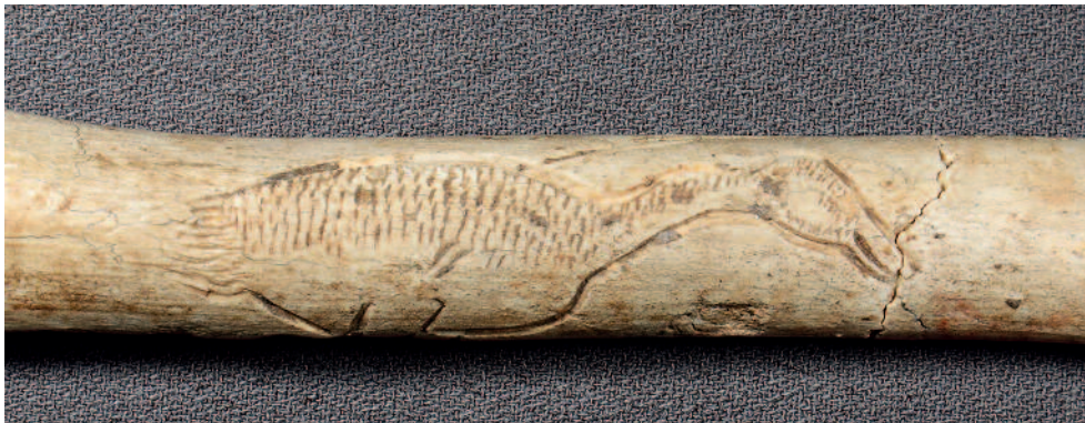
Figure 2 - Gourdan (Haute-Garonne). Bois de renne. Bâton percé. Oie (MAN 47188/47189). Les plumes de l'oiseau ont été suggérées par de fins traits parallèles. Longueur : 5,7 cm.

On note, tout d'abord, la volonté de produire des images traitées dans le détail. Les thèmes ont souvent été traités avec savoir-faire et précision. Le caractère intimiste de certains objets est manifeste par leurs dimensions réduites. Il n'est pas rare que la hauteur ou la longueur des motifs figuratifs soit inférieure ou égale à 3 cm, ce qui n'a d'ailleurs pas empêché les graveurs de figurer le détail des représentations. Suivant une habitude graphique propre au Paléolithique, les éléments importants pour la détermination de l'animal ont été sélectionnés. De même, le pelage des animaux, les plumes des oiseaux (fig. 2, Gourdan, bâton percé. MAN 47188/47189, Schwab 2008 – p. 22) ou les écailles du poisson peuvent avoir été figurés ou suggérés (fig. 3, Lortet, bâton des rennes aux saumons. MAN 47082, Chollet 1964 – p. 132-133). On ne peut qu'être frappé par la finesse des motifs gravés. Dans certains cas, la figuration est de précision millimétrique, et des détails parfois infimes ont été réalisés avec un soin extrême. Les