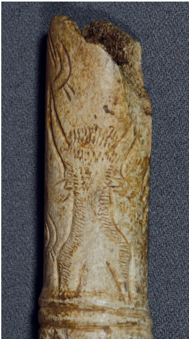
Figure 10 - Gourdan (Haute-Garonne). Bois de renne. Bâton percé. Aurochs vu du dessus (MAN 47079). Longueur de l'aurochs : 4,5 cm.