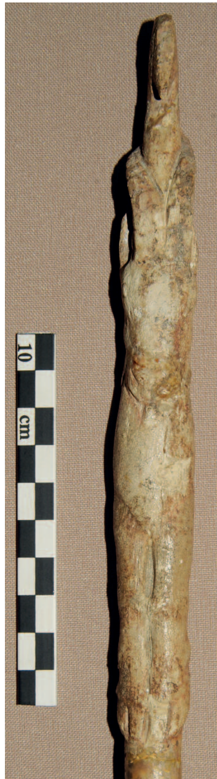
Figure 11 - Mas d'Azil (Ariège). Bois de renne. Propulseur. Bouquetin en vue frontale (MAN 47025).

Au Magdalénien supérieur, les représentations sur petits objets exploitent généralement le champ opératoire pour y placer des motifs de petite dimension, finement gravés. C'est surtout durant cette période que les détails sont abondants, en particulier ceux qui indiquent le pelage des animaux à fourrure, les plumes des oiseaux ou les écailles des poissons. L'un des exemples les plus remarquables est celui du bois de renne de Lortet présentant des cervidés et des saumons (MAN 47082, Schwab 2008 – p. 38-39), sur lequel le corps des poissons figure non seulement la ligne latérale caractéristique, mais aussi les écailles, rendues par de fins tracés courbes entrecroisés. Le détail des ramures ou des encornures, ainsi que ceux de la tête et des pattes (pli du grasset, boulet, sabot...) sont également souvent