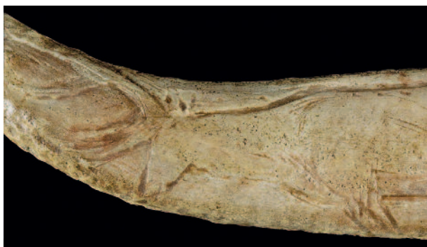
Figure 4 - El Castillo (Cantabrie). Andouiller en bois de cerf. Cerf (détail). Quelques traits finement gravés suggèrent le relief de l'épaule et les plis du cou de l'animal (n° inv. 1709).

Cette précision du traitement impose évidemment au spectateur un regard de proximité, qui devait encore être