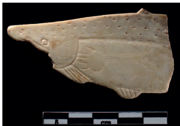
Figure 5 - Lortet (Hautes-Pyrénées). Os. Truite (MAN 47260). Le tube digestif a été fait par impression au moyen d'un instrument tranchant.

Figure 4 - El Castillo (Cantabria). Deer antler. Deer (detail). Some finely engraved lines suggest the shoulder form and the neck folds of the animal (n° inv. 1709).