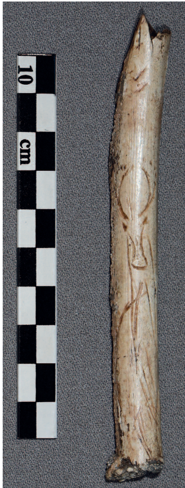
Figure 7 - Gourdan (Haute-Garonne). Bois de renne. Ciseau. Élan vu de face (MAN 47190).

Si l'iconographie est moins rigide, sa présentation n'apparaît pas non plus aussi codifiée. On le sait, dans l'art pariétal la figure animale de profil est la règle, les exceptions étant rares (Lascaux en Dordogne, El Otero en Cantabrie). Dans l'art mobilier du Magdalénien, en revanche, on connaît des représentations animales présentées selon différents points de vue. Des animaux, figurés de profil, ont la tête présentée de face, comme c'est le cas pour un cervidé bondissant sur bâton percé de Gourdan (MAN 47079, Schwab 2008 – p. 21) ou en vue arrière (ciseau de Gourdan, MAN 47431, Schwab 2008 – p. 25 ; spatule de Lortet, Schwab 2008 – p. 42-43 ou pendentif d'El Pendo, [1730/I et II], Arias Cabal & Ontañón Peredo 2005 – p. 168, n° 5). Les têtes animales ou les animaux entièrement figurés de face ne sont d'ailleurs pas exceptionnels, tant dans l'art du sud-ouest français que dans l'art de la Corniche cantabrique. Pour la France, on retiendra par exemple deux têtes de chevaux vues de face – la première sur un bâton percé de Gourdan (fig. 8, MAN 47079), la seconde sur un fragment de perche de bois de renne du même site (MAN 47323, Chollot 1964 – p. 94-95) – et une de bison (MAN 48596, Chollot 1964 – p. 68-69).