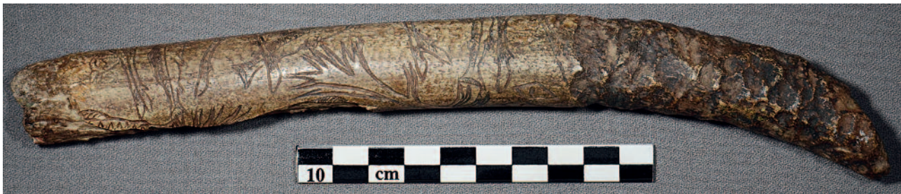
Figure 3 - Lortet (Hautes-Pyrénées). Bois de renne. Bâton percé. Cervidés et saumons (MAN 47082). De petits traits courbes figurent les écailles du poisson. Longueur du saumon : 4,2 cm.