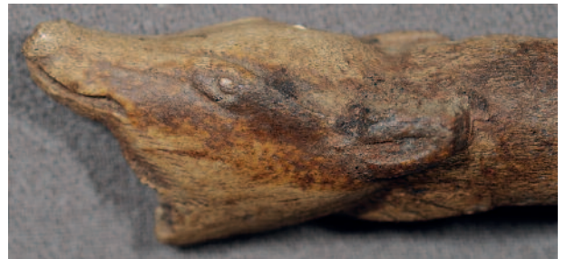
Figure 13 - Arudy (Pyrénées-Atlantiques). Bois de renne. Bâton percé. Tête de renard (MAN 47096). Longueur de la tête : 3,8 cm.

Figure 12 - Grotte du Pape, Brassempouy (Landes). Coxal bone. Half-relief seal. The bone convexity has been used to increase the volume impression of the animal body (MAN 48692).