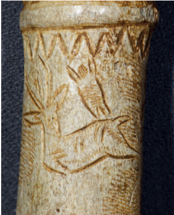
Figure 8 - Gourdan (Haute-Garonne). Bois de renne. Bâton percé. Tête de cheval vue de face et cervidé de profil avec la tête vue de face (MAN 47079).