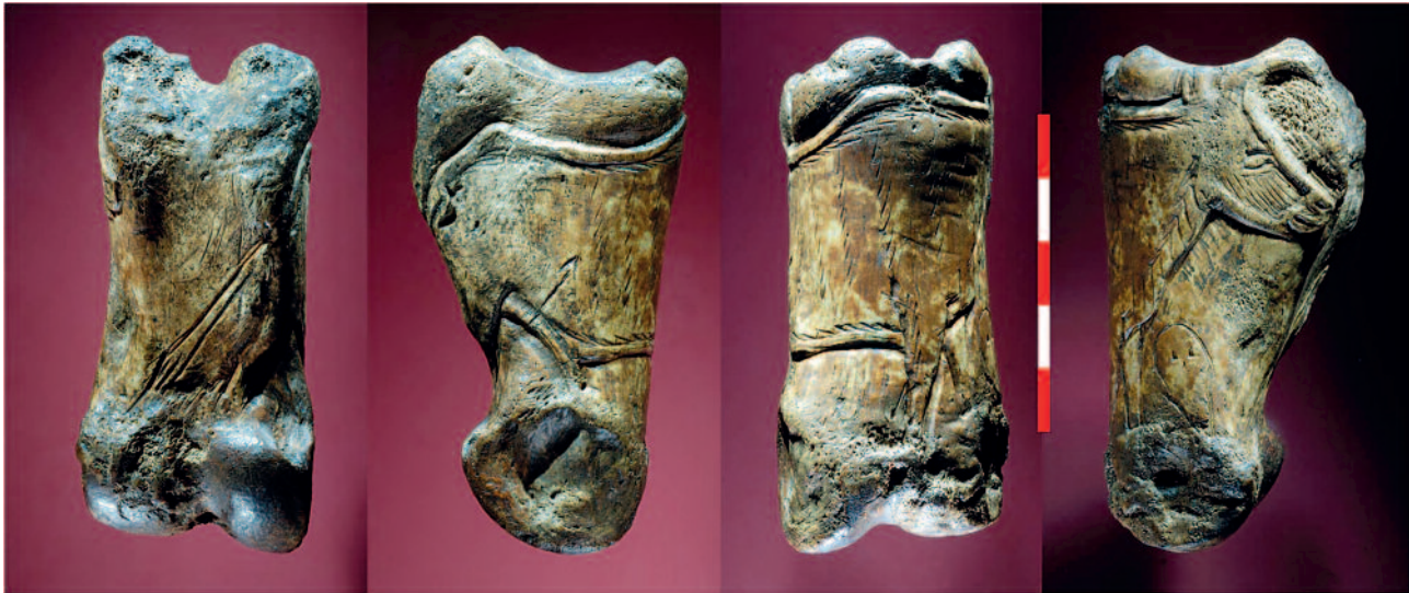
Figure 14 - La Garma (Cantabrie). Phalange de boviné. Aurochs (GI 1001).