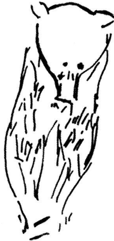
Figure 9 - La Vache (Ariège). Os d'oiseau. Ours vu de face (MAN 83349). Relevé d'après E. Man-Estier (2011 – p. 60, fig. 77, n° 10).

Au plan chronologique, les pièces que nous venons de voir sont contemporaines du Magdalénien supérieur. Il faut remarquer que des figurations de face ont aussi été sculptées durant le Magdalénien moyen, comme c'est le