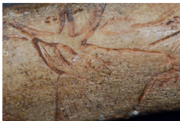
Figure 6 - Gourdan (Haute-Garonne). Bois de renne. Bâton percé. Cerf (MAN 47261). Des restes de colorant rouge sont visibles au niveau des andouillers.

renforcé par le fait que les pièces pouvaient être colorées. On relève encore par endroits sur certaines pièces des traces nettes de couleur, dans le sillon gravé. Nous avons par exemple retrouvé une substance rouge dans le sillon gravé d'un cerf du bâton percé au chamois de Gourdan (fig. 6, MAN 47261, Schwab 2008 – p. 28-29) et de la couleur noire dans la gravure de l'os d'oiseau décoré d'un serpent du même site (MAN 47304, Chollet 1964 – p. 92-93). Des effets de bichromie ont même été obtenus parfois en colorant de noir et de rouge certains segments du décor. La mise en couleur ne touche d'ailleurs pas les seuls motifs figuratifs, comme cela a été mis en évidence sur des objets de la grotte de La Vache (Ariège). Cette finition du décor témoigne du soin extrême avec lequel la facture de ces œuvres a été pensée. La proximité du regard est évidemment aussi de mise pour les objets cylindriques. Les