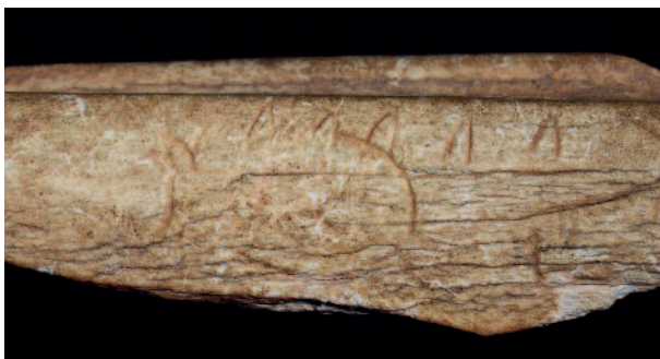
Figure 1 - Limeuil (Dordogne). Os. Renard couché (MAN 57637). L'attitude de l'animal traduit bien le comportement de l'espèce. Longueur : 1,9 cm.

La caractéristique suivante touche le champ mimétique, qui donne sens à l'image. Comme dans l'art pariétal, les représentations de l'art mobilier sont avant tout animales. Toutefois, nous aurons l'occasion de voir que le cortège des animaux figuré est moins strictement conditionné que dans l'art sur paroi rocheuse. La volonté mimétique est également évidente, puisque la majorité des animaux peut être déterminée jusqu'au niveau du genre, voire de l'espèce. De même, et malgré les faibles dimensions de ces supports, les motifs figurés sont loin d'être statiques. De nombreux animaux sont représentés dans des attitudes qui indiquent le remarquable sens d'observation de ces