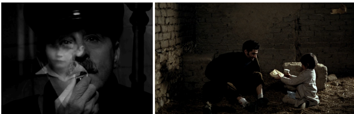
Imagen 5. Sobreimpresión entre la imagen real del niño y la recreación ficcional del cartero en La Morte Rouge (Victor Erice, 2006). Nautilus Films.

por tanto, no enfrenta el miedo, no supera el trauma. El cineasta adulto en el que se convierte lo gestiona mediante una ficción donde Ana, su alter ego , no se esconde del espíritu (Frankenstein-Potts) ni de su transposición en la realidad (el maquis-el cartero), sino que sale en su busca para encontrar al maquis en la casa del pozo [Imagen 6] y a Frankenstein en su propia imaginación.