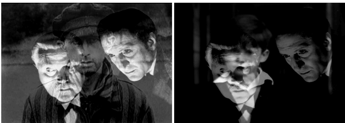
Imagen 1. Sobreimpresión entre realidad histórica y ficción. Imagen 2. Sobreimpresión entre ficción y experiencia infantil. La Morte Rouge (Victor Erice, 2006). Nautilus Films.

En este momento, el fundido encadenado se convierte en el primer elemento retórico de este proceso de indiscernibilidad. Materializa el desplazamiento del miedo de la ficción al de la realidad histórica, la de la posguerra española y la Segunda Guerra Mundial: «... para el público La garra escarlata era, sobre todo, una película de miedo. Salvo que en este caso el miedo se desplegaba más allá de la pantalla, prolongando su eco en el ambiente de una sociedad devastada». De nuevo, la imagen documental del film-ensayo evoca e invoca la creación ficcional de El espíritu de la colmena . Lo que para el individuo adulto es una actividad lúdica a través de la cual gestionar el miedo que impone la realidad, para el niño, ajeno todavía a la diferenciación entre ficción y realidad, se convierte en trauma. El fundido encadenado utilizado entre los fotogramas anteriores se ralentiza ahora para provocar la sobreimpresión, y producir una frase-imagen simbolista del mismo: sobreimpresión entre el horror del nazismo y el terror de la ficción [Imagen 1] y sobreimpresión de ese mismo miedo ficcional sobre el rostro del niño que no será capaz de diferenciarlos [Imagen 2]: «Este dolor universal, ¿pesaba de algún modo en el corazón del niño de cinco años que, en compañía de su hermana –ella tenía siete años más–, caminaba hacia la penumbra de un cine, para ver la primera película de su vida? Es difícil saberlo».