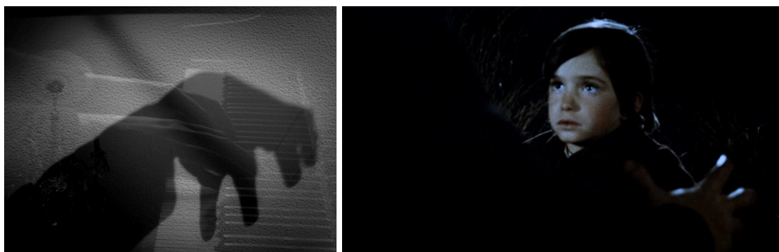
Imagen 7. Transformación de la garra en la mano del pianista en La Morte Rouge . (Victor Erice, 2006). Nautilus Films.