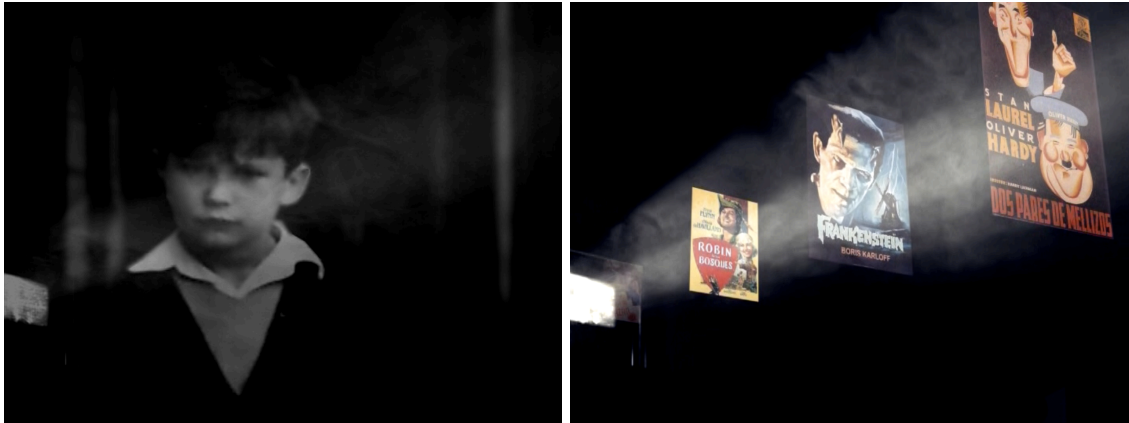
Imagen 9. El haz de luz cinematográfico atraviesa la foto del niño Víctor. Imagen 10. De ese haz surgen las películas que siguieron al visionado de La garra escarlata , entre las que se encuentran El doctor Frankenstein . La Morte Rouge (Victor Erice, 2006). Nautilus Films.

La ausencia de esta escena en el montaje final se justifica así en el texto que la precede: