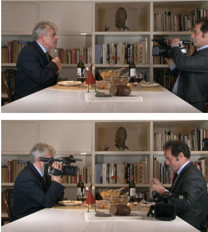
Figura 7 y 8. J'aimerais partager le printemps avec quelqu'un (Joseph Morder, 2007).

De la misma manera, la experiencia de la realidad se hibrida con la creación de una ficción: “... nos filmamos los dos en nuestra vida cotidiana. Y bajo la mirada del espectador, nos transformamos de forma regular y según las circunstancias en personajes de ficción, antes de volver a nuestros asuntos diarios” (Cavalier, 2011, s.p.). Si Morder insertaba la ficción en el diario sin evidenciarla, proponiendo una discusión sobre su indiscernibilidad, Cavalier aborda esta misma cuestión a través de su oposición dialéctica.