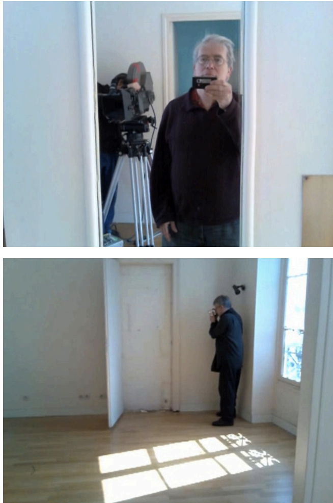
Figura 5 y 6. J'aimerais partager le printemps avec quelqu'un (Joseph Morder, 2007).

propio trabajo cinematográfico y la actividad como filmeur de Cavalier. El total despojamiento del gesto fílmico de ambos cineastas queda registrado.