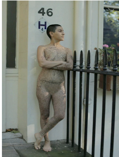
Imágenes 13 y 14. Life May Be (Mark Cousins y Mania Akbari, 2014).