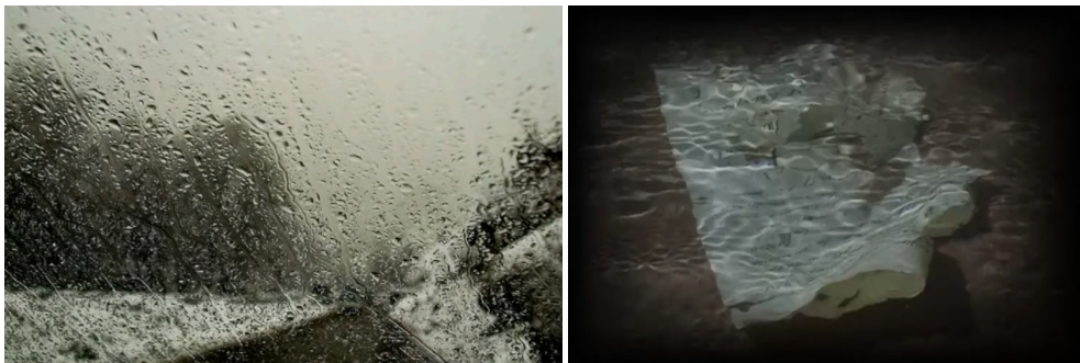
Imágenes 7 y 8. Correspondencias (Víctor Erice y Abbas Kiarostami, 2005-2007).

La última misiva de Erice, Escrito en el agua , pudiera concentrar las respuestas a las dos cartas de Kiarostami. En primer lugar, y de forma explícita, muestra el final del viaje de la misiva, descompuesta en el agua del mar. En segundo lugar, contesta a Rain : el paisaje filtrado por el dibujo de la lluvia sobre el parabrisas se convierte ahora en los restos epistolares filtrados por el agua del mar (Imagen 8). El agua como metáfora, en ambas misivas, del fenómeno de intersubjetivización. Se evidencia así el éxito de la correspondencia como generador de intersubjetividad en relación a la temática de la creación.