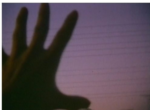
Imagen 5 y 6. This World (Naomi Kawase y Hirokazu Kore-eda, 1996).