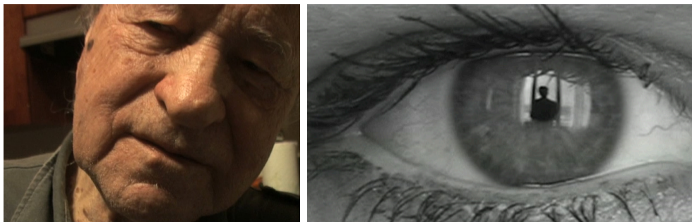
Imágenes 11 y 12. Correspondencia de José Luis Guerin y Jonas Mekas (2011).