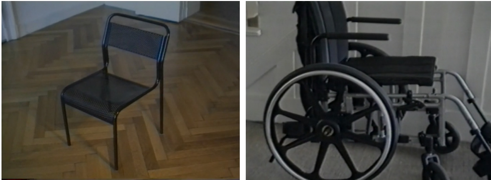
Imagen 3 y 4. Videoletters (Robert Kramer y Stephen Dwoskin, 1991).