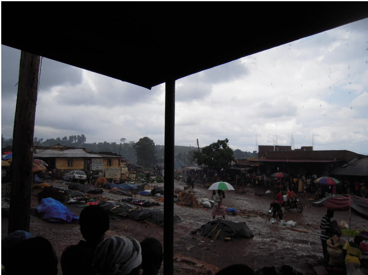
Illustration 6. Trombes d'eau sur le marché de Kamus, Mont Elgon (Racaud, 2016)

Ces assemblages en un lieu, celui de l'échange, ces faire avec des lieux, « définissent de nouvelles lectures de l'espace et de ses potentialités, de nouveaux rapports au temps, de nouvelles solidarités... en somme de nouvelles identités » (Vidal, Musset, 2015, p. 9). Ces relations au soi se fondent sur des complémentarités ville-campagne, sur l'élaboration d'une classe flexible d'itinérants, sur la mobilité, sur la précarité et sur l'incertitude, en premier lieu celle de ne pas vendre. La question de l'être est liée à celle des lieux (Radkowski, 2002) puisque ces relations à sa propre singularité, à cet être itinérant , entrepreneur, colporteur de la nouveauté dont on peut être soi-même la vitrine sont liées à des marchés et à des quartiers marchands. Les vendeurs combinent et organisent des centralités marchandes rurales et urbaines dans leurs modes d'habiter, et, aux différents lieux de la route marchande, ils associent des représentations et des pratiques. Ils réunissent « dans un même agencement faisant sens pour (au moins) un