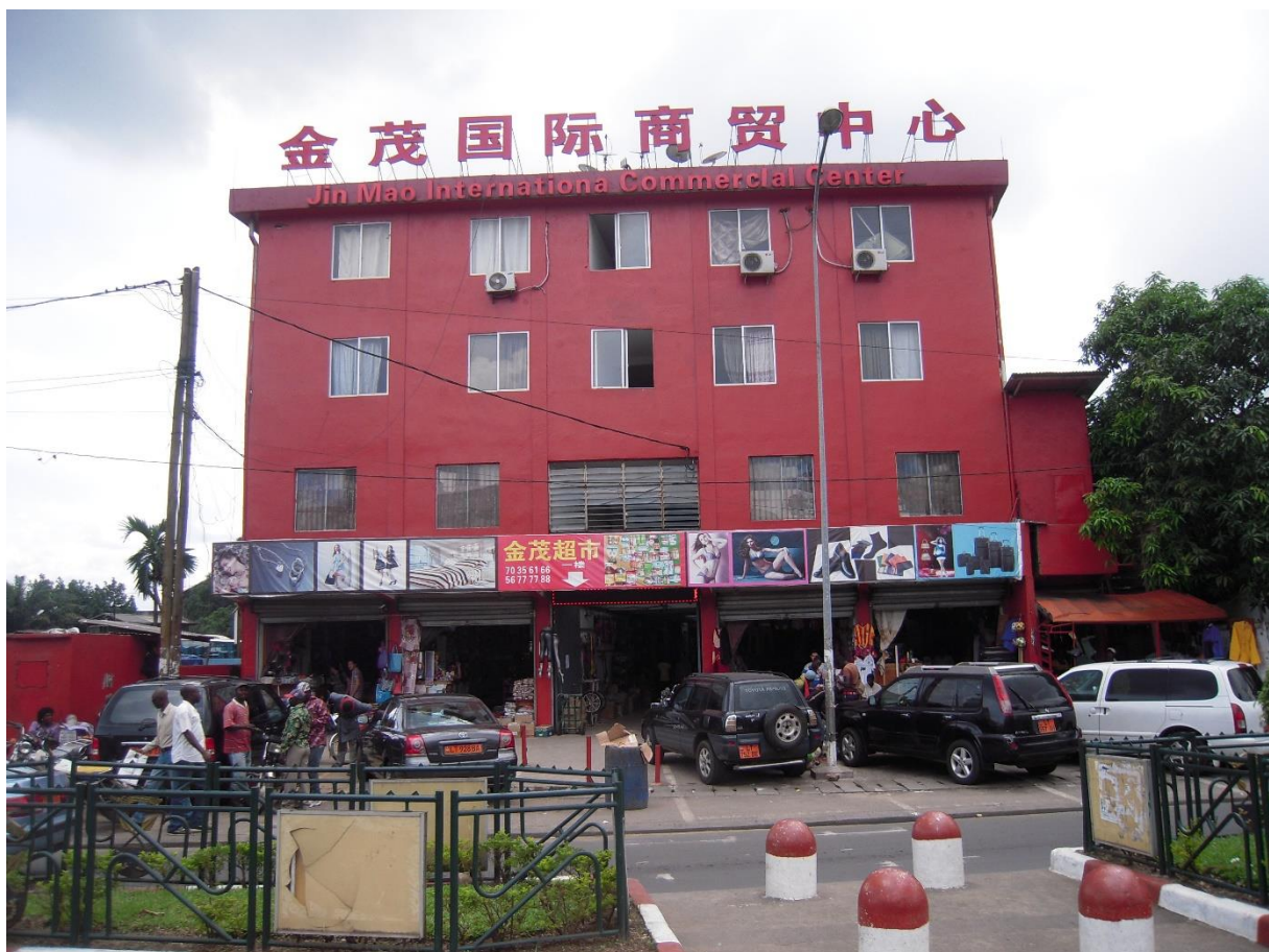
Illustration 4. Chinatown à Douala : les attributs chinois de la mondialisation qualifient le lieu (Racaud, 2014)

Les paysages commerciaux se « verticalisent » par le biais de baux emphytéotiques et d'investissements chinois (en particulier à Douala, Dar es-Salaam et Kampala), ce qui pousse parfois les nationaux dans les arrière-cours et les interstices de la mondialisation. À un autre niveau, la compétition est forte pour accéder au moindre m 2 , fut-il un bout de trottoir, lieu de travail et de sociabilité pour les innombrables vendeurs de rue qu'on trouve dans les métropoles