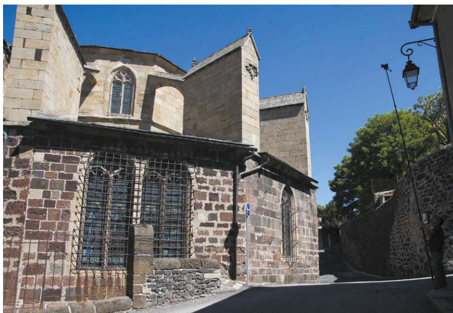
Figure 5. Prise de vue à la perche (ici sur l'église abbatiale Saint-Chaffre)

rotule, qui est prévue pour le poids d'un appareil photo, bien supérieur à celui du distancemètre, et qu'il est difficile de manier avec assez de précision. On trouve dans le commerce un support à vis micrométrique qui résout probablement ce problème (Leica FTA 360 par exemple). De même, certains de ces appareils sont munis d'une caméra facilitant le repérage du point de mesure, difficile à voir en extérieur.