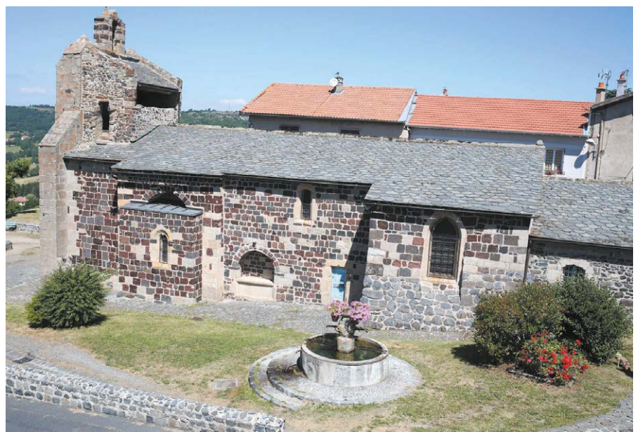
Figure 1. Saint-Jean-Baptiste au Monastier-sur-Gazeille (XII, XV et XVIII e siècles) Haute-Loire