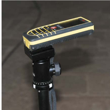
Figure 2. Le distancemètre sur sa rotule

Pour notre test nous avons utilisé un Disto Leica D5 dont la précision donnée par le constructeur est de l'ordre de 1 mm pour les distances et 0.3° pour les inclinaisons.