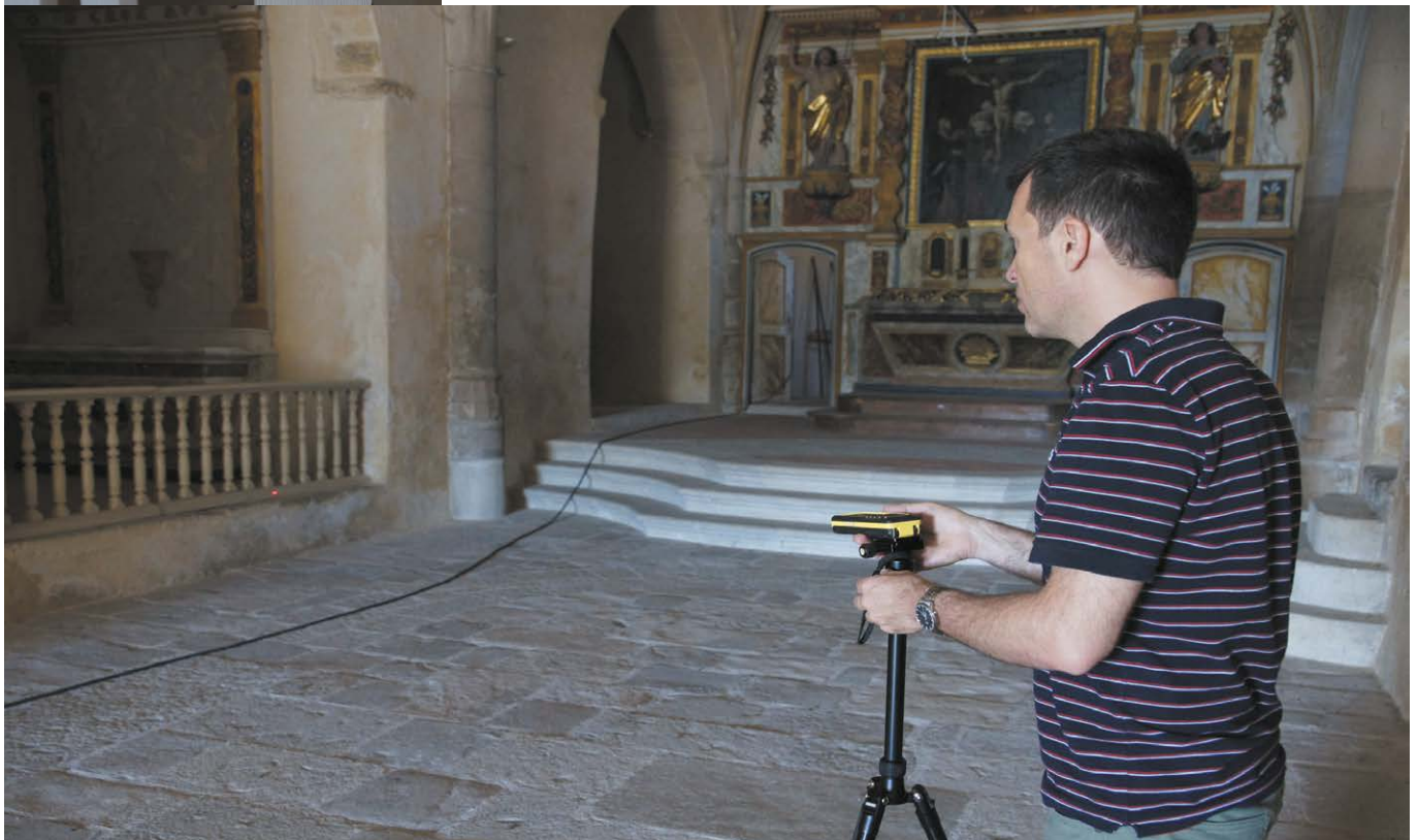
Figure 3. Exemple de cible (haut) et de pointage d'une cible (bas)