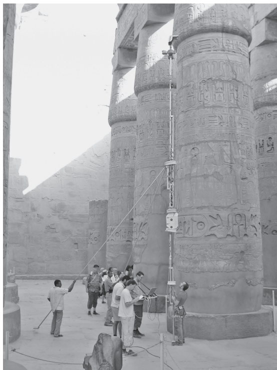
FIG. 2. – La « perche » mise au point par l'équipe de l'ENSG. Les quatre appareils photographiques calibrés qui y sont fixés, sont déclenchés simultanément à partir d'un ordinateur (E. Laroze).

tranches verticales à l'aide d'une perche de huit mètres sur laquelle quatre appareils photographiques étaient fixés à des hauteurs différentes (fig. 2). Un ordinateur, installé à la base du mât permettait de contrôler le cadrage et d'assurer le déclenchement simultané des quatre appareils. En raison du manque de recul suffisant, les décors des colonnes périphériques orientés vers les murs ont été photographiés « manuellement », depuis une échelle de huit mètres (fig. 3).