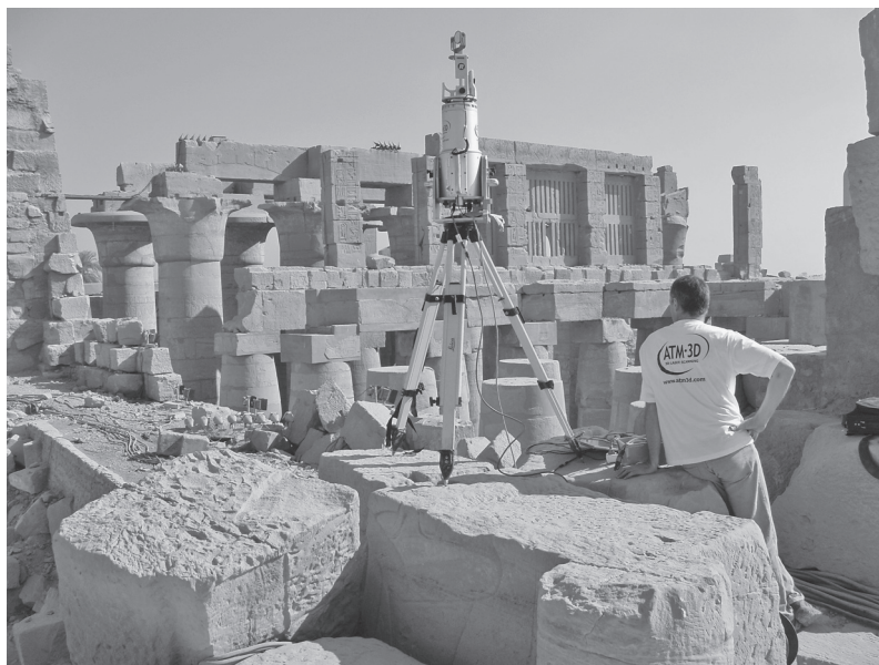
FIG. 1. – Le scanner en action dans l'angle sud-ouest de la salle hypostyle.

scanners laser 3D (mesure laser haute densité, sans contact et longue portée). Les technologies de numérisation 3D ont trente ans : l'Institut de Technologie de l'Information du Conseil National de Recherche du Canada fut l'un des premiers laboratoires à mettre au point un scanner 3D, en 1978 20 . Mais c'est au début des années 1990 que les premiers appareils sont commercialisés. En France, deux réalisations spectaculaires témoignent des débuts du levé haute densité : la numérisation de la Grotte Cosquer (automne 1994) 21 et celle du colosse d'Alexandrie (1997) 22 . Ces exemples marquants n'ont pourtant utilisé « que quelques » centaines de milliers de points.