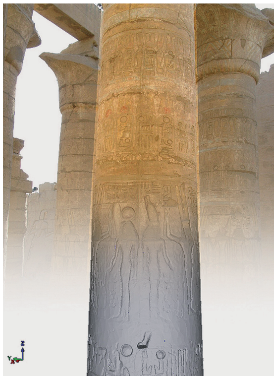
FIG. 5. – Superposition d'un cliché photographique calibré avec une vue du modèle 3D. Grâce aux informations photogrammétriques il est possible de retrouver le positionnement exact de l'appareil photographique et par conséquent de faire correspondre un cliché avec un modèle numérique (B. Chazaly).