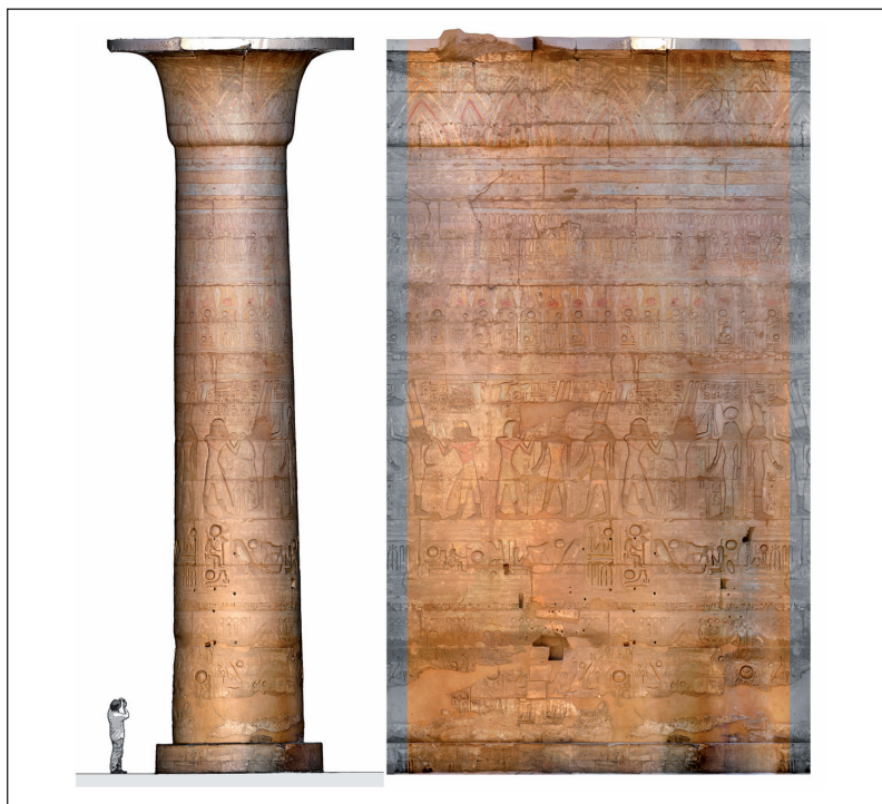
FIG. 6. – Modèle numérique coloré de la colonne 2n et son développé orthophotographique correspondant (Atm3d/Cfeetk).