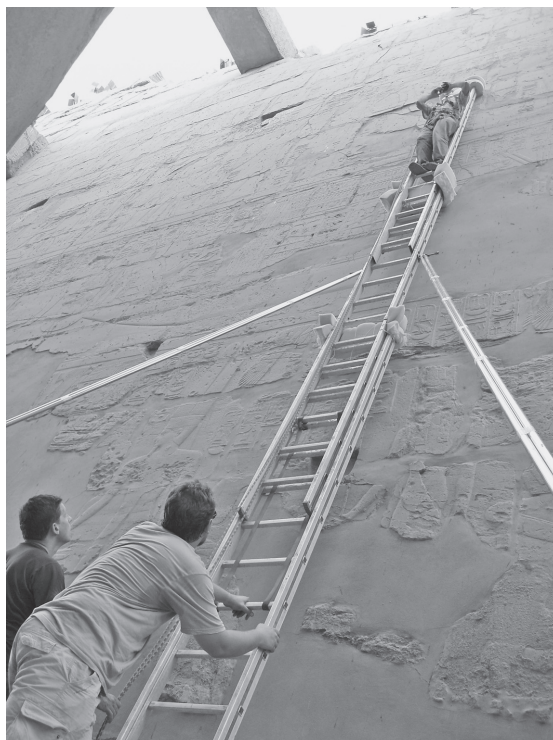
FIG. 3. – Le long des parois, les prises de vue ont été réalisées « manuellement » depuis une échelle.

dans la salle, pour contribuer à homogénéiser la radiométrie des photographies. Malgré ces mesures, ces problèmes persisteront mais seront partiellement corrigés par les outils informatiques.