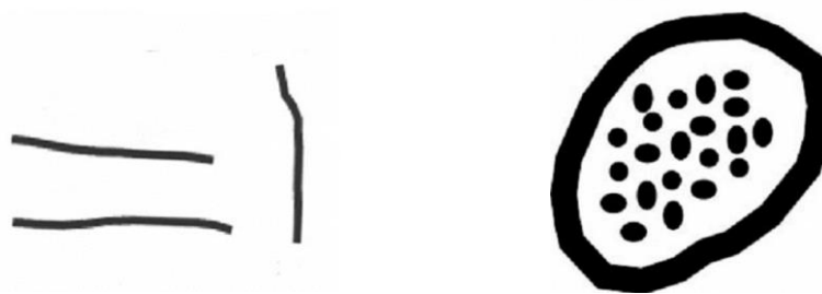
Figure 1 et 2 : Saurez-vous identifier ces dessins ?

Avant d'aller plus loin et de vous parler plus précisément de la problématique de l'illustration tactile, saurez-vous identifier les objets représentés dans les deux dessins ci-dessous ? Ils ont été dessinés par les enfants aveugles. Je révélerai l'identité de ces dessins plus tard de mon intervention.