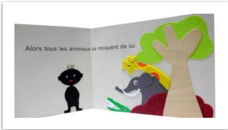
Illustration du livre La culotte de Boubou, LDQR (2009)

Pendant 3 ans, j'ai travaillé à la maison d'édition Les Doigts Qui Rêvent où j'ai entamé un processus de réflexion avec l'équipe sur les façons d'explorer les possibilités multisensorielles d'une illustration et d'un contenu narratif. J'ai conçu le schéma ci-dessous pour montrer les bénéfices d'un modèle illustratif engageant des manipulations par rapport à au modèle illustration visuelle mise en relief. Mon hypothèse est que ces illustrations sont non seulement mieux reconnues par les enfants aveugles mais aussi qu'elles favorisent davantage le partage: aveugles et voyants ouvrent une porte de la même manière, mais seulement les voyants ont accès à cette forme globale de la maison. Le livre la Chasse à l'ours édité par Les Doigts Qui Rêvent est le fruit de la réflexion entamée avec l'équipe pendant ces années. Ce livre met en avant de l'expérience du corps dans les illustrations.