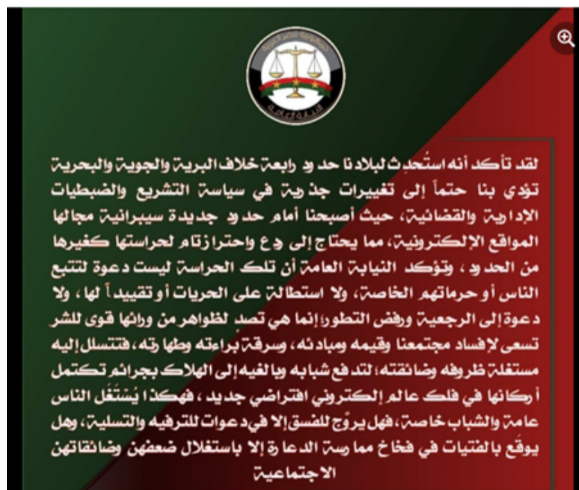
Ministère public égyptien, 2 mai 2020 (Facebook)

Dans un communiqué du 2 mai 2020, tout en se défendant de vouloir limiter les libertés publiques, le ministère public affirma la nécessité de lutter contre « les forces du mal » ( quwwa li'l-shirr ) qui cherchent à « corrompre ( ifsad ) notre société, ses valeurs ( qiyam ) et ses principes ( mabadi' ) et voler son innocence ( bara'a ) et sa pureté ( tahara ) [...] pour pousser ses jeunes et ses adultes vers la perdition ( halak ) ».