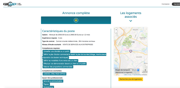
FIGURE 1 – Plate-forme KeeSeeK dédiée à la recherche d'un emploi et d'un logement

La société KeeSeeK ( https://www.keeseek.com/ ) est une plateforme nationale de recherche combinant à la fois une offre d'emploi et une offre de logement. Dédiée aux besoins des entreprises en recherche de candidats à la mobilité professionnelle, la société KeeSeeK propose des offres de logements meublés facilitant la prise du poste et l'intégration dans la région de l'offre du poste. La Figure 1 montre l'interface présentée à un candidat.