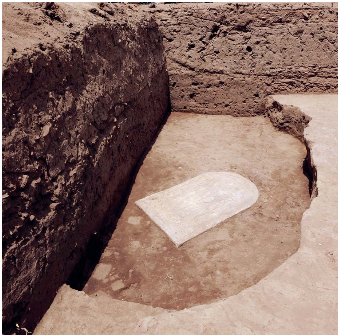
Fig. 2. La stèle de Ramsès III lors de la découverte © Cnrs-Cfeetk/L. Moulié.