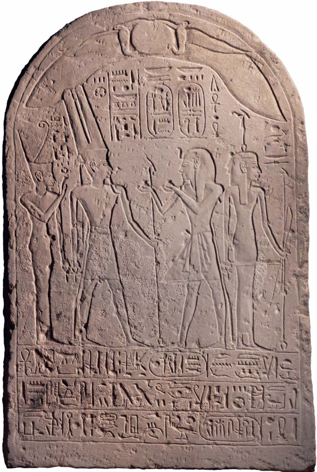
Fig. 3. La stèle de Ramsès III © Cnrs-Cfeetk/L. Moulié.