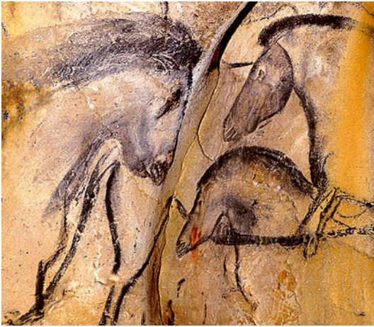
Fig. 1 : Chauvet (Ardèche) : détail du panneau des chevaux (Photo Jean Clottes, Ministère de la Culture)

par la qualité graphique des représentations de la grotte Chauvet en Ardèche (fig. 1). Les quatre splendides têtes de chevaux du secteur du même nom de cette grotte montrent tout le savoir-faire d'un artiste expérimenté. Le contour est tracé au crayon de charbon de bois avec souplesse et précision. Sans négliger les caractéristiques et l'allure générales, le dessinateur a rendu jusque dans le détail – pour la tête – le front, le chanfrein, le naseau, les lèvres, le menton et la ganache de l'animal ; et il n'est pas jusqu'au modelé anatomique qui n'ait été rendu grâce à l'application plus ou moins dense de matière colorante pulvérisée sur la paroi (travail à l'estompe).