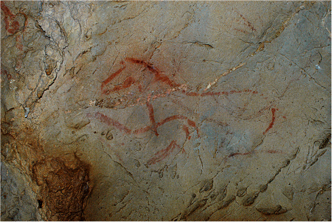
Fig. 3 : La Pasiega A (Cantabrie) : cheval peint en rouge, dont la couleur a été appliquée au moyen d'un tampon