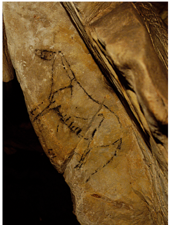
Fig. 2 : Las Monedas (Cantabrie) : cheval noir avec le « M » ventral caractéristique (collection de l'auteur)

Cette qualité graphique remarquable s'impose d'ailleurs quelle que soit la technique utilisée. Le dessin est présent dans de nombreux sites : la ligne de contour est alors exécutée au moyen d'un crayon noir (charbon de bois ou de bioxyde de manganèse) ou rouge (hématite) plus ou moins épais. Il arrive aussi que le contour ait été peint. Là encore, les techniques d'application peuvent être diverses : la couleur liquide ou pâteuse peut avoir été étendue au pinceau ou au moyen d'un tampon, comme on le relève dans les grottes