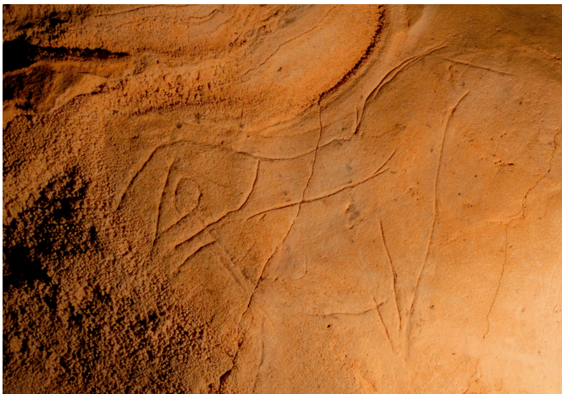
Fig. 6 : El Castillo (Cantabrie) : cheval gravé dans un « médaillon » au plafond de l' « Entrée gravettienne »

cé incisé, dont la justesse et le sens esthétique ne sauraient laisser indifférent l'historien de l'art travaillant sur les arts des périodes historiques. Ces tracés peuvent être incisés plus ou moins profondément, suivant l'effet optique que l'artiste du Paléolithique a voulu produire. Dans « l'entrée gravettienne » d'El Castillo, un cheval a été profondément gravé dans un « médaillon » naturel du plafond de la galerie : le sillon large isole véritablement l'animal de son support, en même temps qu'il