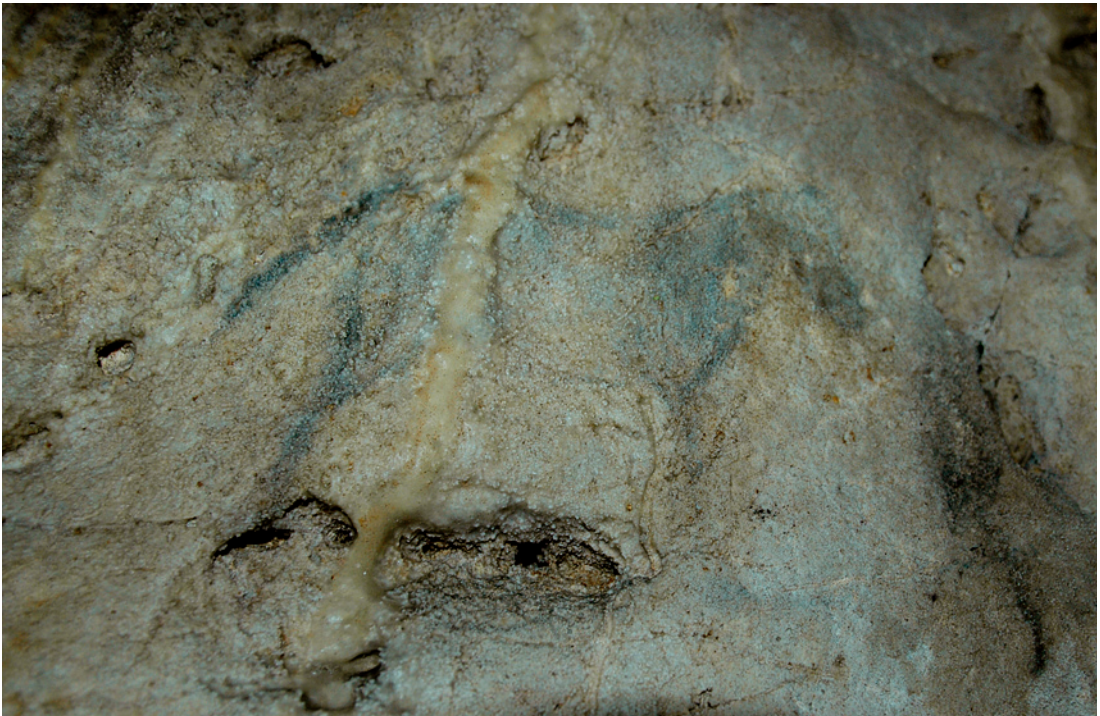
Fig. 4 : El Castillo (Cantabrie) : cheval noir en aplat (collection de l'auteur)