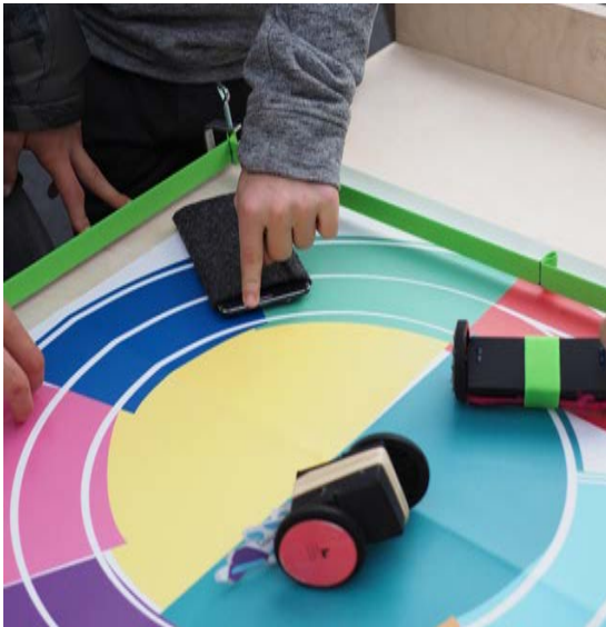
Figure 3 : Atelier du 01/11/2018 — Manipulation du capteur de proximité et de l'accéléromètre pour faire avancer les modules