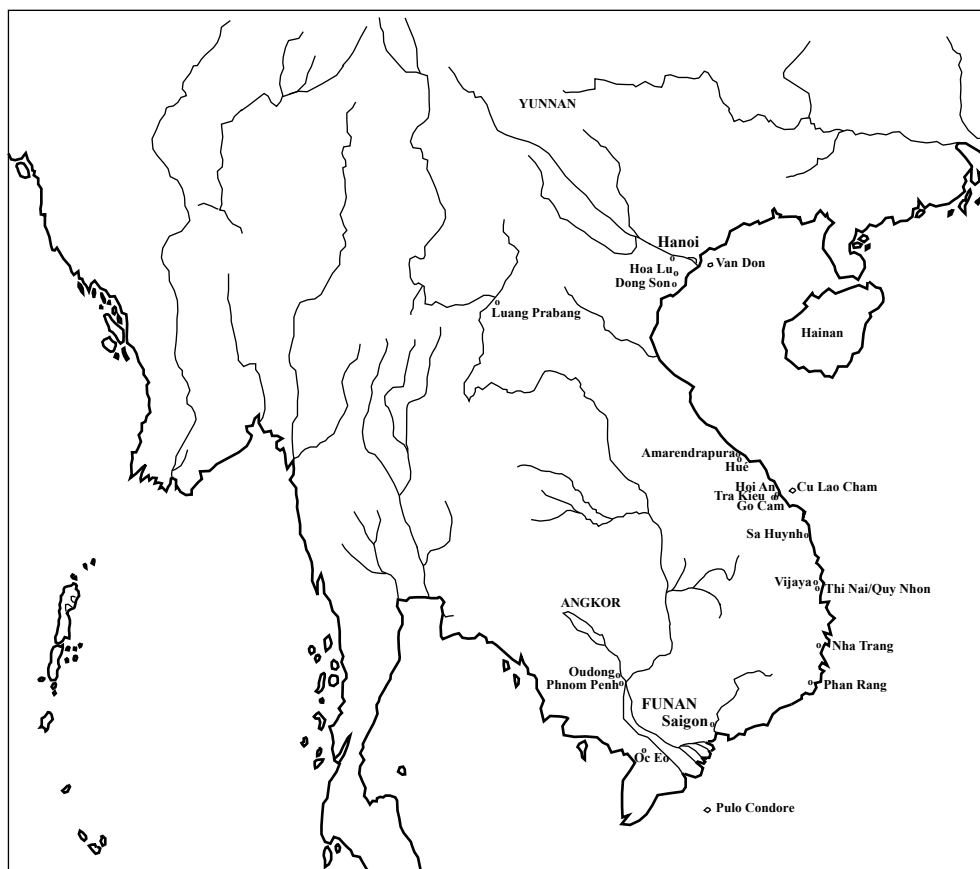
Péninsule indochinoise : principaux toponymes cités