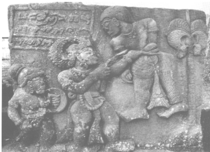
Une inscription de Candi Sukuh (Java Central, milieu XV e s.) Parmi les dernières inscriptions sur pierre en vieux javanais.