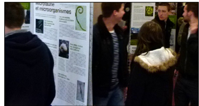
Figure 12 - L'exposition, au Conservatoire Européen d'Echantillons de Sols, INRAE Orléans.