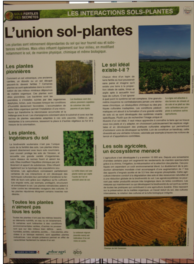
Figure 9 - Exposition dans le cadre d'une rencontre organisée par la Communauté de Communes Eure Madrie Seine - 26 février 2016 - 50 participants.