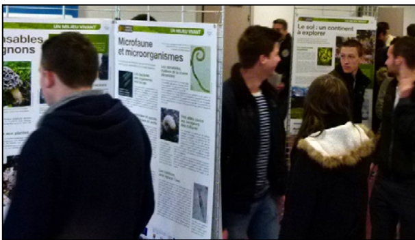
Figure 11 - Exhibition "Soils and secret lives" at the agricultural high school of Robillard - 13 March to 1st April 2015 - 150 students.