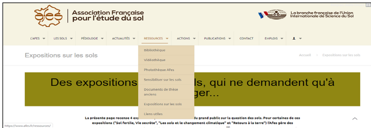
Figure 13 - Overview of the AFES website dedicated to the exhibition.