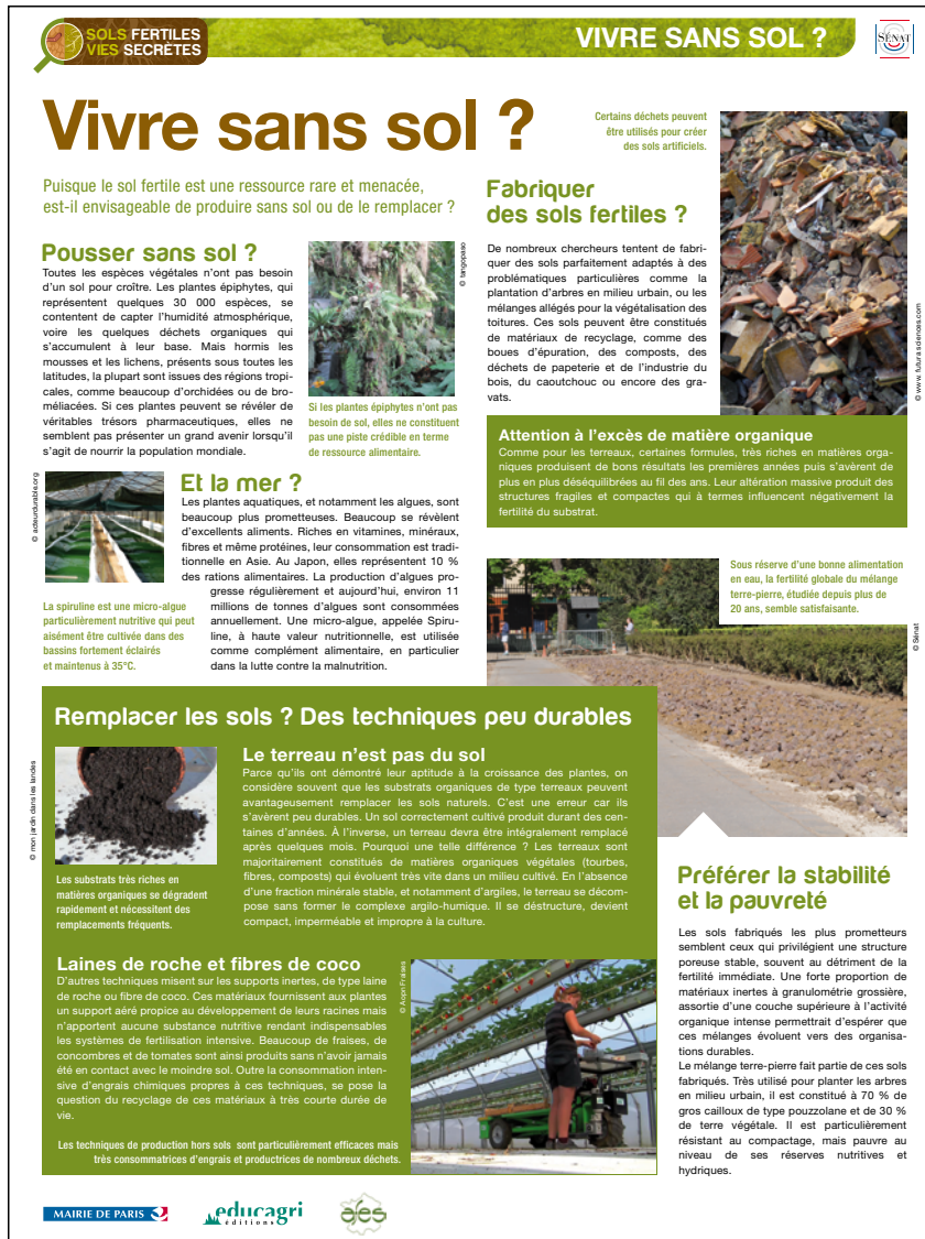
Figure 5 - Aperçu du 3 e panneau de l'exposition : Vivre sans sol ?

Puisque le sol fertile est une ressource rare et menacée, est-il envisageable de produire sans sol ou de le remplacer? Même si certaines plantes peuvent pousser sans sol ou que différents travaux de recherche se penchent sur la possibilité de construire des sols fertiles (à partir de matériaux organiques et minéraux de recyclage comme des boues de stations d'épuration, des composts, des déchets de papeterie et de l'industrie du bois...), ce panneau (figure 5) met en avant le caractère encore peu durable des techniques visant à remplacer les sols. Des travaux de recherche restent effectivement encore à mener pour pouvoir reconstituer la multifonctionnalité des sols naturels à partir de reconstitution de sols.