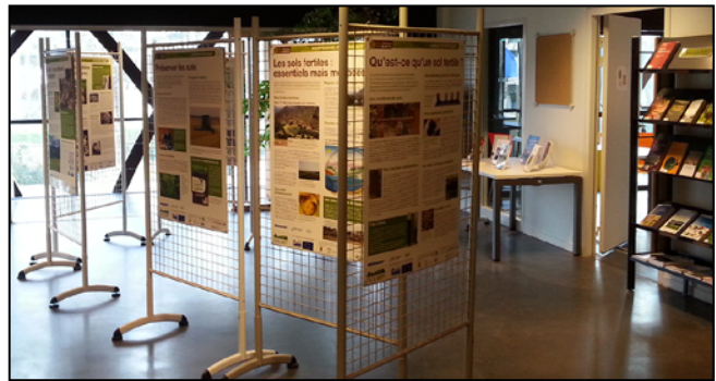
Figure 11 - Exposition Sols fertiles vies secrètes au lycée agricole du Robillard du 13 mars au 1er avril 2015 - 150 étudiants mobilisés.