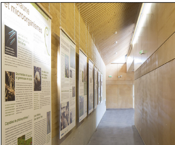
Figure 12 - The exhibition, at the European soil sample archive building, INRAE Orléans.

(Arrouays et al. , 2002; Jolivet et al. , 2006), de campagnes de profils réalisés lors d'opérations parfois anciennes, et de nouvelles campagnes concernant des sites instrumentés suivant les flux de gaz à effet de serre sur l'ensemble de l'Europe (Franz et al. , 2019; Arrouays et al. , 2019). A ce conservatoire est adossée une salle de conférences permettant d'accueillir de nombreux événements. Les panneaux de l'exposition sont affichés dans un lieu de passage très fréquenté, reliant la salle de conférences au conservatoire proprement dit ( figure 12 ). Le bâtiment est essentiellement construit en pisé, qui présente des qualités thermiques adaptées, notamment à la conservation des échantillons de sol, et qui porte en outre plusieurs messages importants: « conserver les sols dans du sol », « les sols sont aussi un matériau de construction », « le circuit-court » et le « gaspillage » des sols sont « optimisés » puisque l'essentiel du matériau utilisé pour le pisé a été extrait du sol excavé pour les fondations du bâtiment.