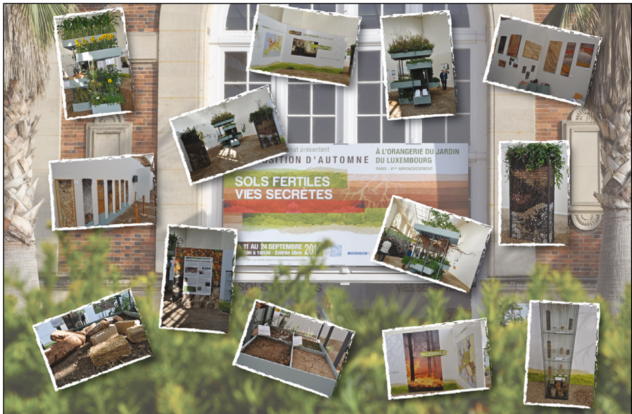
Figure 3 - Photo editing showing the diversity of the contents of the Senate's exhibition.

la circulation dans l'exposition, des exemples de sols comme matériaux de construction et des vitrines présentant différents sols et minéraux. La figure 2 présente un montage de différentes photographies prises par Sacha Desbourdes (INRAE Orléans) lors de l'inauguration de cette exposition.