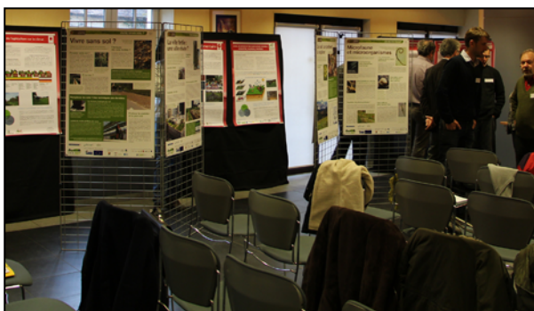
Figure 9 - Exhibition in the framework of an event organized by the municipalities of Eure Madrie Seine - 26 February 2016 - 50 attendees.