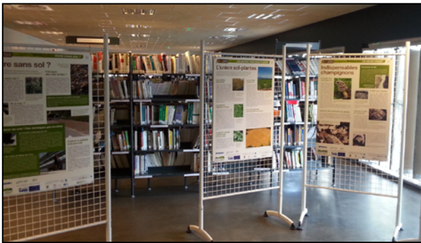
Figure 10 - Exhibition "Soils and secret lives" - Library of the school of Agricultural Engineers ESITPA. 6-13 March 2015.