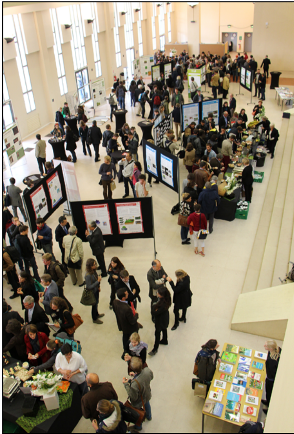
Figure 8 - Indoor space Aula MAGNA. University of Caen Basse Normandie - 13-14 October 2014 in the framework of the national meeting "Sols contre tous" (untranslatable play on words) - 400 attendees.