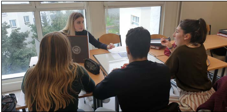
Figure 1. Table de jeu réunissant quatre étudiant-e-s dont trois PJ et une MJ du groupe L3 Gestion des Entreprises. Afin de rendre l'entrée dans l'activité la plus aisée possible, nous avons conçu un système de règles simplifiées disponible en Annexe 2.

construction collégiale de cette histoire. Le maître mot est bien l'interactivité entre les participants ». Néanmoins, cette définition nécessite quelques précisions afin d'être plus opérationnelle. Le tableau de synthèse présentant les différentes formes de JdR et proposé par Zagal & Deterding (2018, p.44-45) apporte alors tous les éléments nécessaires. Nous noterons ici simplement certains aspects concrets et complémentaires à notre définition précédente : le TRPG est majoritairement mis en œuvre par des groupes de 2 à 6 participant-e-s autour d'une table physique (nous verrons dans la partie « Perspectives » de cette communication des solutions alternatives virtuelles). Les figures 1 et 2 montrent des exemples de tables de JdR en cours d'anglais à l'IAE Gustave Eiffel (école de management de l'UPEC) réunissant quatre étudiant-e-s (trois PJ et une MJ).