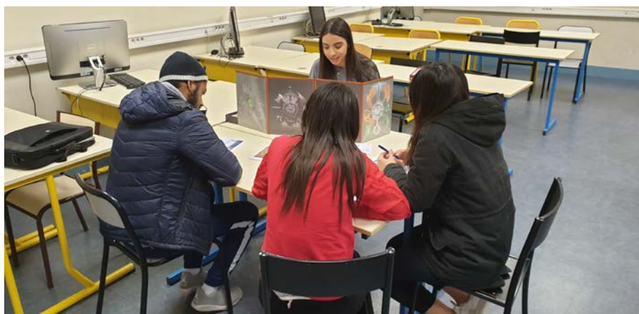
Figure 2. Table de jeu réunissant également quatre étudiant-e-s dont trois PJ et une MJ du groupe L3 Informatique & Management. Afin que les étudiant-e-s puissent se concentrer sur l'histoire, il est nécessaire d'avoir suffisamment de salles de disponible.