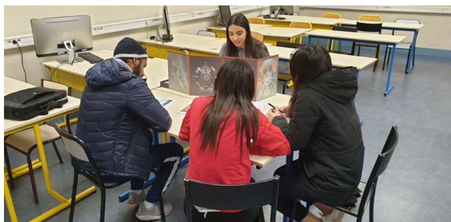
Figure 2. Table de jeu réunissant également quatre étudiant-e-s dont trois PJ et une MJ du groupe L3 Informatique & Management. Afin que les étudiant-e-s puissent se concentrer sur l'histoire, il est nécessaire d'avoir suffisamment de salles de disponible.