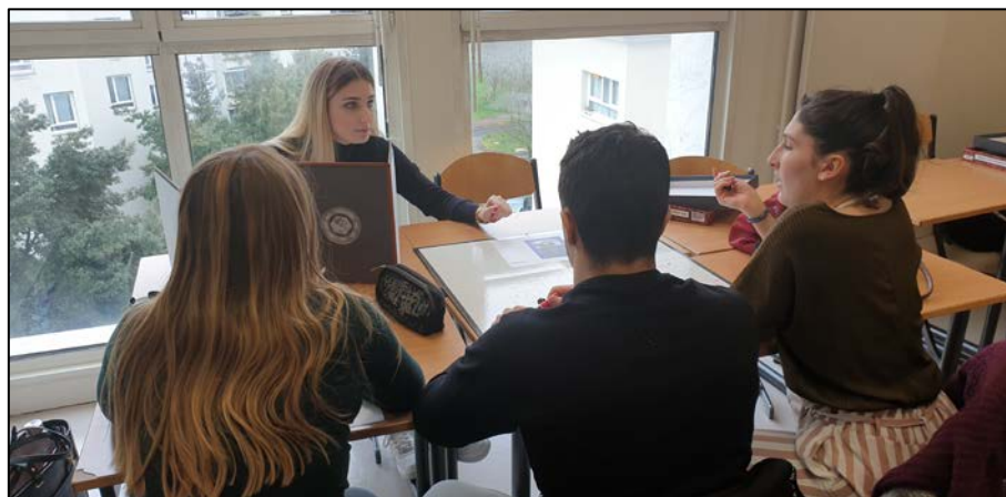
Figure 1. Table de jeu réunissant quatre étudiant-e-s dont trois PJ et une MJ du groupe L3 Gestion des Entreprises. Afin de rendre l'entrée dans l'activité la plus aisée possible, nous avons conçu un système de règles simplifiées disponible en Annexe 2.

construction collégiale de cette histoire. Le maître mot est bien l'interactivité entre les participants ». Néanmoins, cette définition nécessite quelques précisions afin d'être plus opérationnelle. Le tableau de synthèse présentant les différentes formes de JdR et proposé par Zagal & Deterding (2018, p.44-45) apporte alors tous les éléments nécessaires. Nous noterons ici simplement certains aspects concrets et complémentaires à notre définition précédente : le TRPG est majoritairement mis en œuvre par des groupes de 2 à 6 participant-e-s autour d'une table physique (nous verrons dans la partie « Perspectives » de cette communication des solutions alternatives virtuelles). Les figures 1 et 2 montrent des exemples de tables de JdR en cours d'anglais à l'IAE Gustave Eiffel (école de management de l'UPEC) réunissant quatre étudiant-e-s (trois PJ et une MJ).