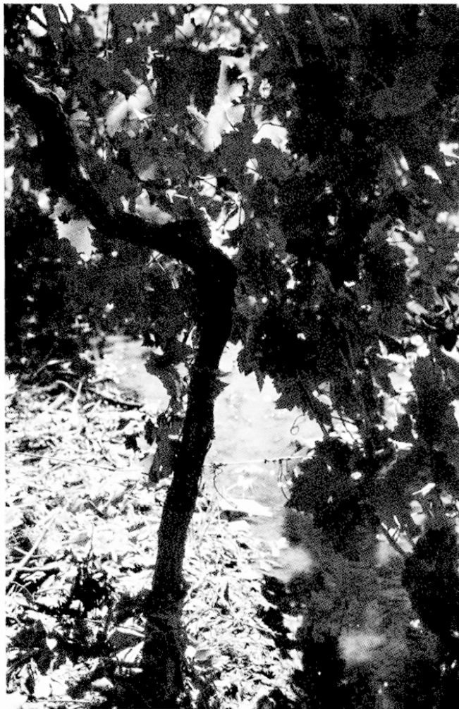
Fig. 1 – Irrigation de la vigne par gravité

Cette pratique est imposée par la sécheresse qui prévaut dans le centre du Chili. Elle est réduite à deux irrigations par an dans les vignobles recherchant la qualité.