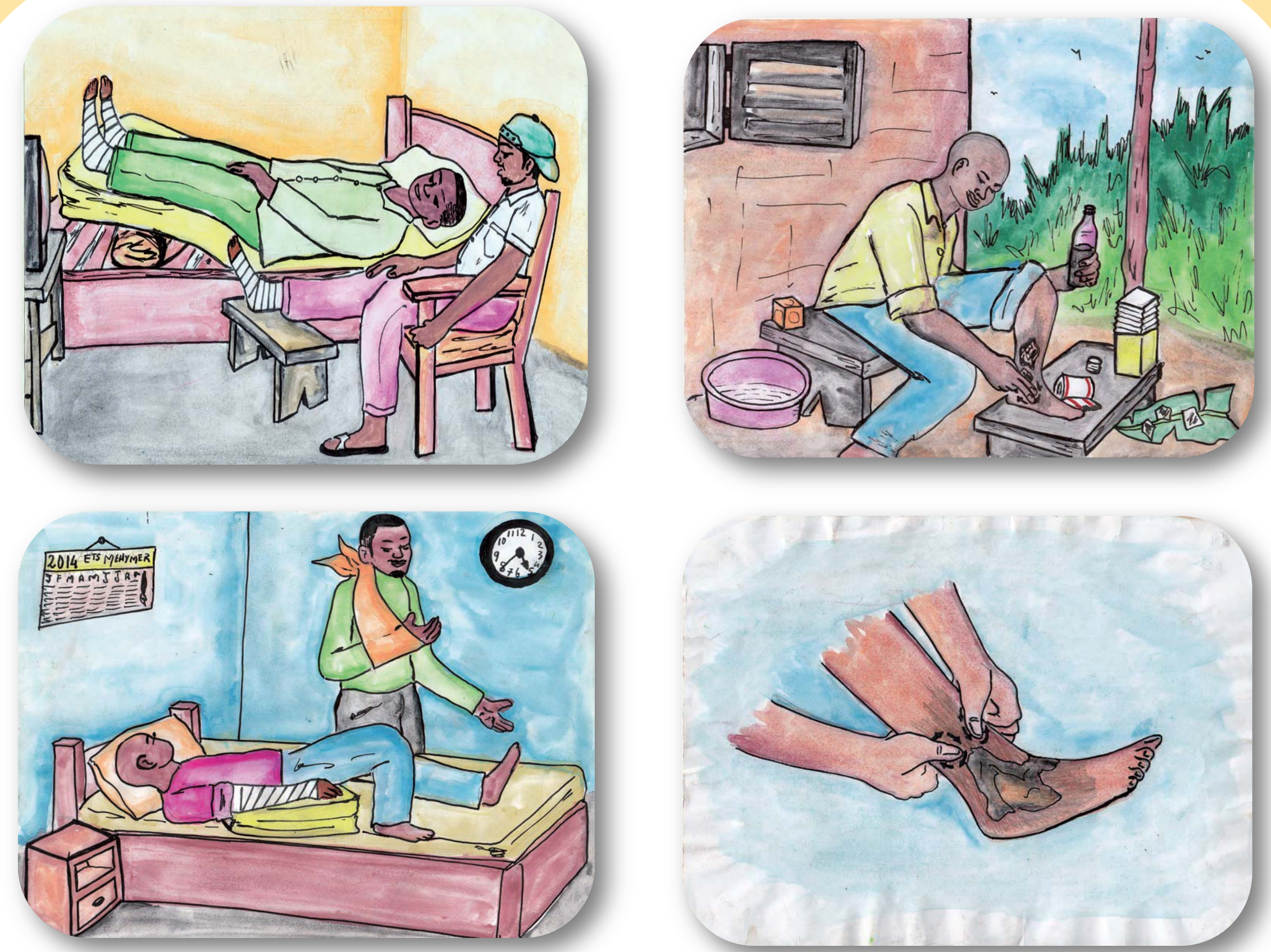
Figure 2. Lutte contre l'œdème et la perte de mouvement