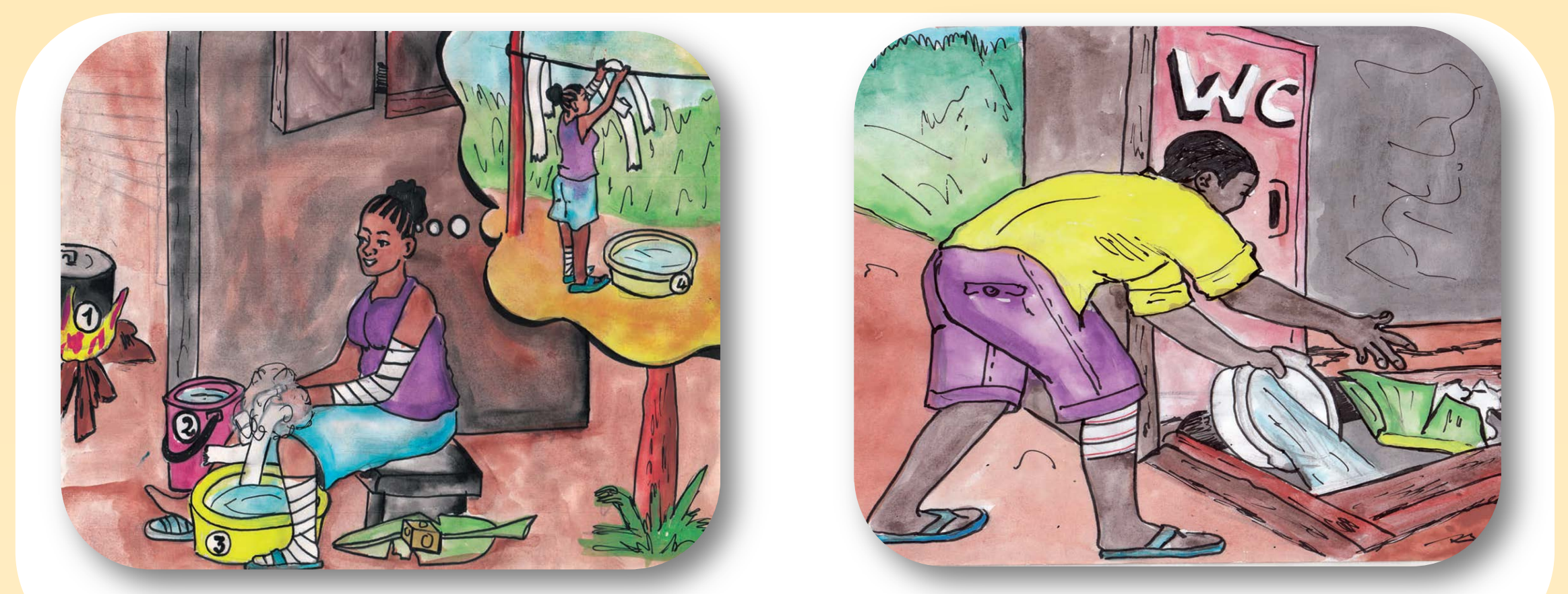
Figure 3. Gestion des déchets