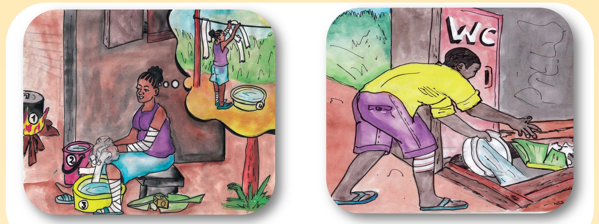
Figure 3. Gestion des déchets