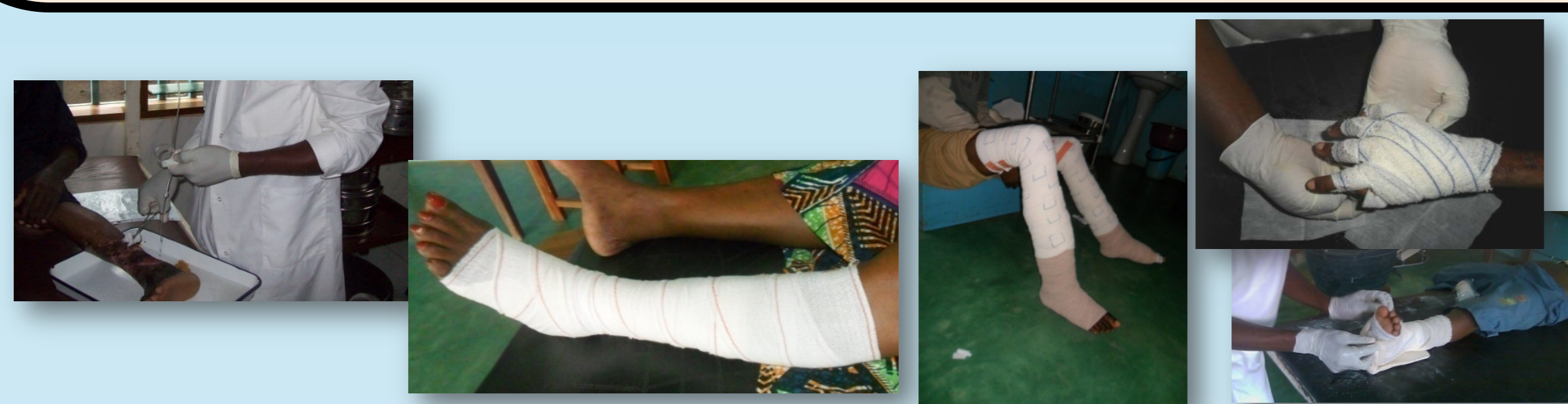
Interventions dans la Prévention des Incapacités (Anticiper!!!)

Il convient donc de mettre en place une stratégie applicable universellement à tous sans toujours modifier les interventions.