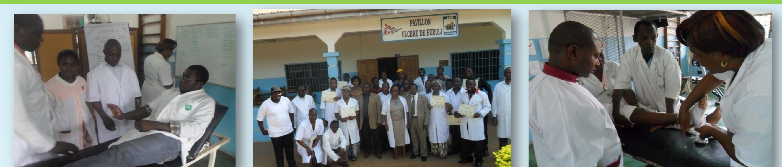
Figure 4: La formation comme intervention dans la Prévention des Incapacités (Tasségning et al., 2015)