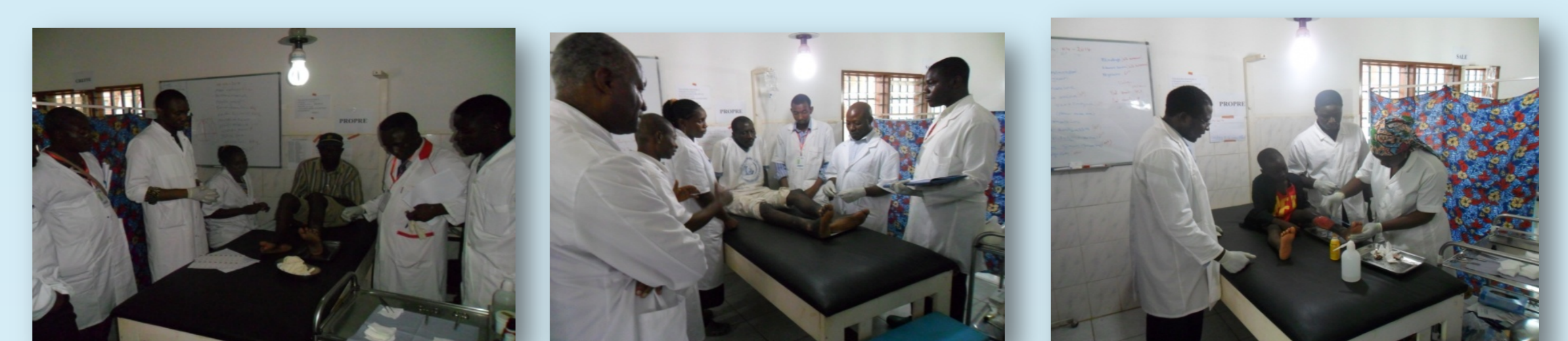
Interventions dans la Prévention des Incapacités (anticiper, former)