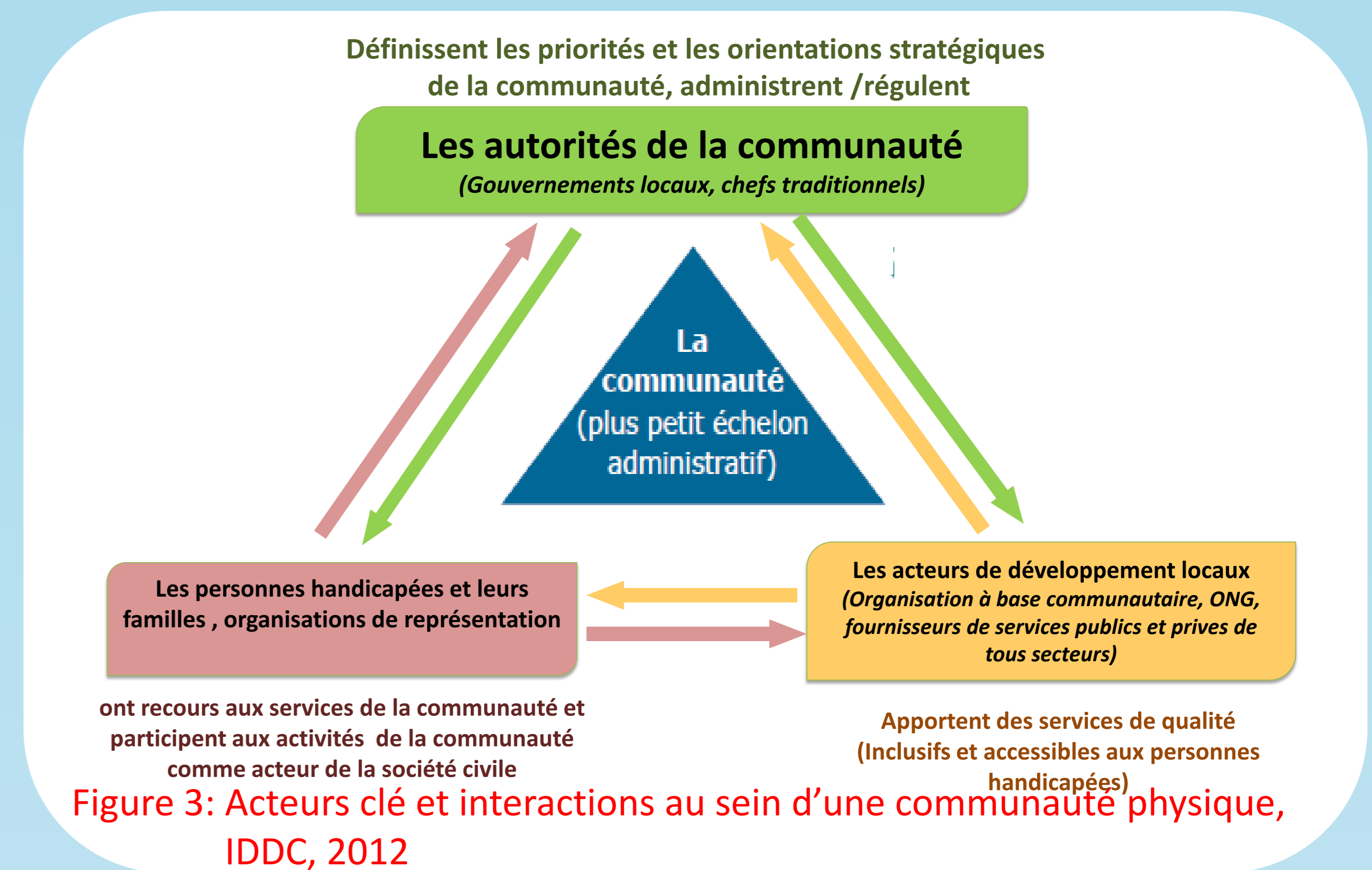
Figure 3: Acteurs clé et interactions au sein d'une communauté physique, IDDC, 2012