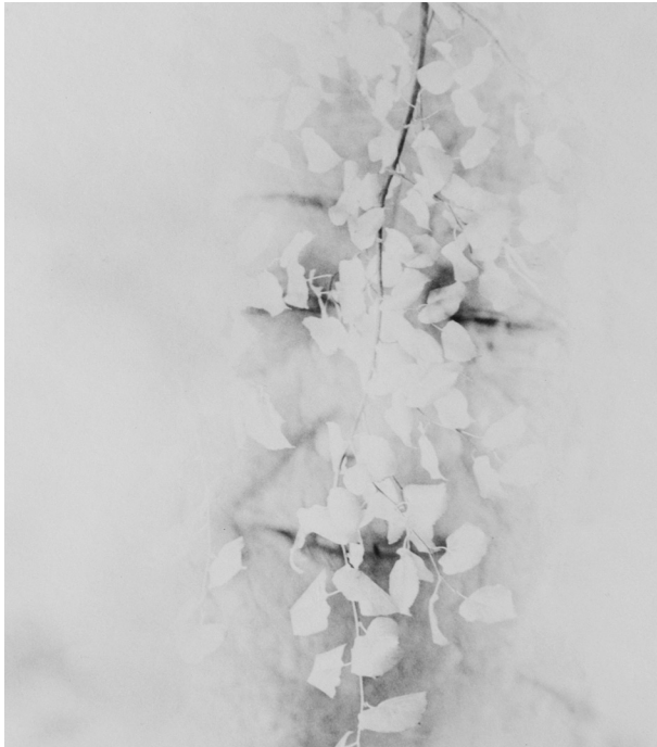
“Ester II” serie Santos y Sombras / serie Santos y Sombras / Saints and Shadows (1997)

Otras veces, la artista introduce una distancia entre pasado y presente por un juego de mise en abyme consistente en insertar fotografías dentro de la fotografía subrayando así la materialidad del soporte (ver por ejemplo “¿Sólo una sombra? / Only a Shadow? (Faiga)”, Santos ). Barthes afirma con razón que la fotografía en sí es siempre invisible –lo es aún más con lo numérico– ya que lo que orienta la mirada es el referente (ver 18). Al invertir este orden entre referente y soporte, Muriel Hasbún construye un filtro con el objeto de la representación. Escenifica un pasado solamente parcialmente alcanzable a partir de lo que queda, de la huella –aquí la imagen–. Dicho de otro modo, insiste en su carácter mediato.