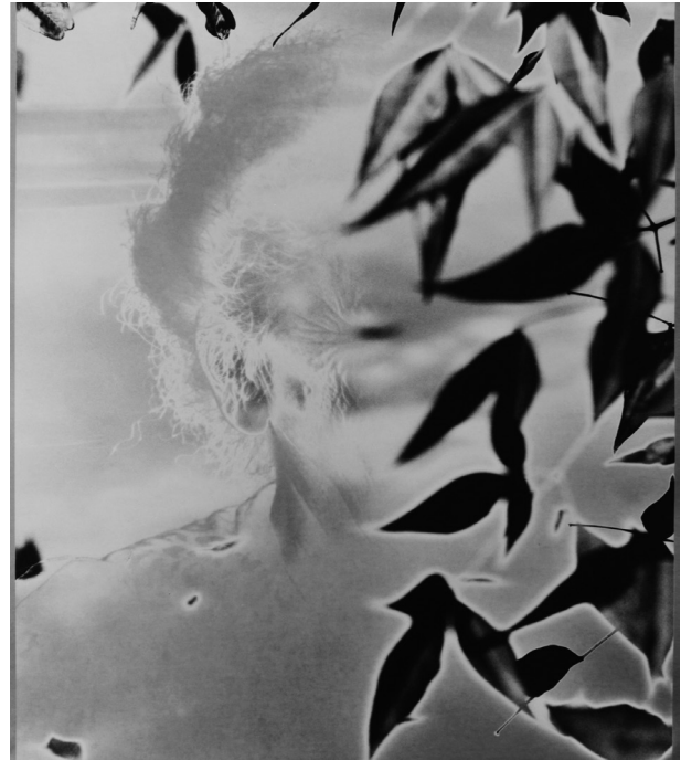
“Ester III” serie Santos y Sombras / serie Santos y Sombras / Saints and Shadows (1997)

Su obra se sitúa, por ende, en una oscilación perpetua entre presencia y ausencia que nos parece responder a lo que el especialista francés en historia del arte Paul Ardenne nombra “estética desaparicionista” (ver 441-450), una tendencia considerada por él predominante en el arte occidental del siglo XX. Ésta se manifiesta por eliminar el cuerpo de la