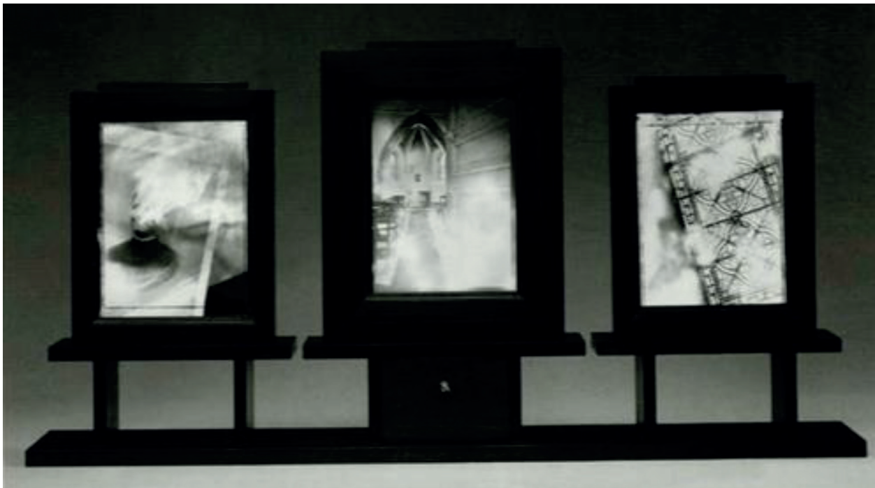
“Triptych II”, serie Protegida: Auvergne, toi et moi / Watched Over: Auvergne-You and Me (1996-2003)

107). Lo religioso —a la vez lo católico y lo judío que heredó respectivamente de su padre y madre— es un elemento clave para entender lo que podríamos definir como una sacralización o fetichización de la huella en su obra. En efecto, las dos series que se refieren al Holocausto, Santos y Sombras / Saints and Shadows y Protegida: Auvergne, toi et moi / Watched Over: Auvergne-You and Me , se articulan en torno al rezo: más allá de los cirios y de las cruces que aparecen en numerosas fotografías, la construcción de sus exposiciones no deja de aludir a la espiritualidad. Varios trípticos formados de cuadros de madera se parecen a pequeños altares (ver foto 5). Utiliza también telas de lino heredadas de su abuela materna judía en las que imprime sus fotografías intentando así establecer una conexión simbólica entre el soporte y la representación, una bella imagen de la mortaja. De este modo, su obra se convierte en un mausoleo que invita al recogimiento y donde los vivos pueden encontrar por fin un lugar para recordar.