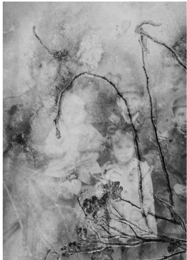
“¿Sólo una sombra? (Familia Łódź) / Only a Shadow? (Łódź Family)”, serie Santos y Sombras / Saints and Shadows (1997)

con una sobreexposición que viene a blanquear los rostros hasta dejarlos muy borrosos, transparentes y casi irreconocibles, así como la inserción en el primer término de una rama de flores recubierta de escarcha que forma una barrera entre pasado y presente. Dentro de esta composición estática, el único elemento dinámico proviene de la progresiva desaparición a la que asistimos como si el tiempo estuviera carcomiendo lentamente los rasgos.