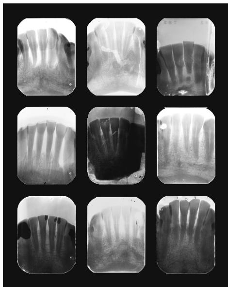
“Study for X post facto (0.1-0.9)” Serie X post facto ( équis anónimo ) (2013)

a establecer un nexo entre las dos tragedias (ver foto 6). De hecho, Muriel Hasbún suele construir puentes entre sus diferentes identidades y los diversos países que las atraviesan. 23 Un buen ejemplo lo constituyen los títulos de sus producciones que son siempre multilingües. En “Volcán de Izalco, amén / Izalco Volcano, Amen” de la ya citada serie Santos y Sombras , inscribe en el paisaje salvadoreño una plegaria cristiana escrita del puño de su bisabuelo en árabe dedicada a “todos los santos y mártires” (ver foto 7). Vemos aquí esta voluntad de hacer dialogar sus múltiples orígenes y los diferentes eventos históricos como lo sugiere ese volcán que remite a la masacre de 1932.