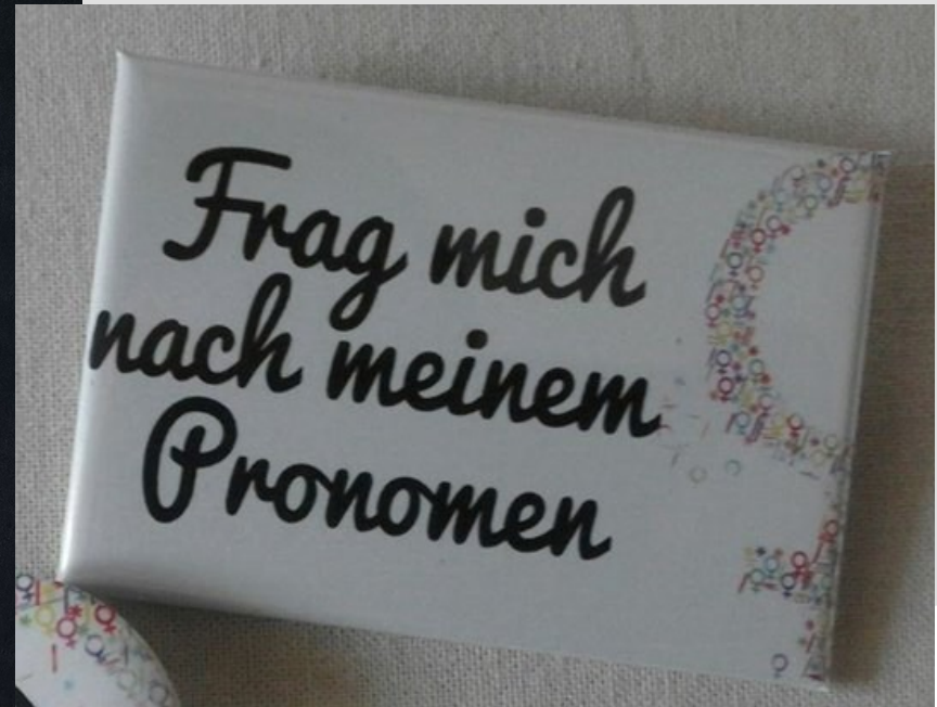
“Frag mich nach meinem Pronomen” pin, Lady*Fest Karlsruhe, December 2018