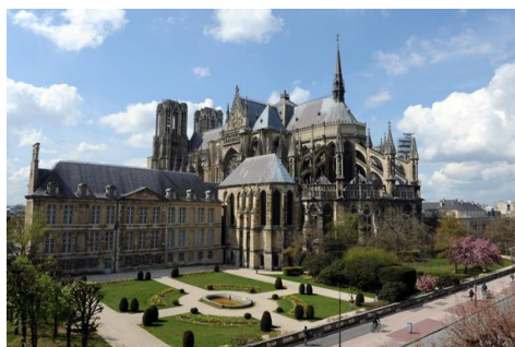
1 Façades Nord Est de la cathédrale Notre-Dame et du palais du Tau

En 2020, quarante cinq sites français sont inscrits sur la liste du patrimoine mondial de l'Unesco et trente sept sur la liste indicative. Depuis 2016, la loi française LCAP rend les plans de gestion obligatoires pour tout bien Unesco. Dès lors, le besoin en expertise patrimoniale et d'aménagement de la part des collectivités territoriales croît. Face à ces enjeux, l'architecte peut devenir un acteur clef au regard des ses compétences. Cette recherche en décryptant la démarche d'élaboration d'un plan de gestion à l'Unesco , propose de le questionner comme projet territorial et comme outil de gouvernance .