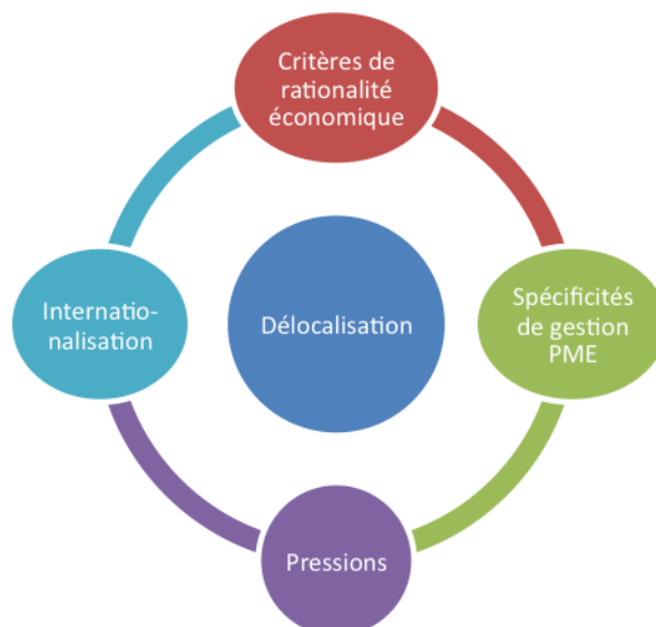
Figure 2 La prise de décision de délocalisation dans le contexte des PME

La préférence des dirigeants de PME pour les stratégies de niche et les relations de proximité avec leurs parties prenantes qui réduisent les à-coups de la concurrence disqualifient une analyse de la décision s'appuyant principalement sur l'étude des coûts d'approvisionnement et les coûts salariaux. Bien plus, elle montre que le mimétisme considéré parfois comme une faiblesse du décideur peut s'ancrer lui aussi dans une relation de proximité avec ses avantages en termes de réduction des coûts d'accès à l'information voire des coûts de transaction. Les choix d'une délocalisation de proximité effectués par certains dirigeants montrent que cette décision peut ne pas être une stratégie de fuite, mais de recomposition sur laquelle peut s'appuyer une nouvelle forme de développement, dont l'internationalisation.