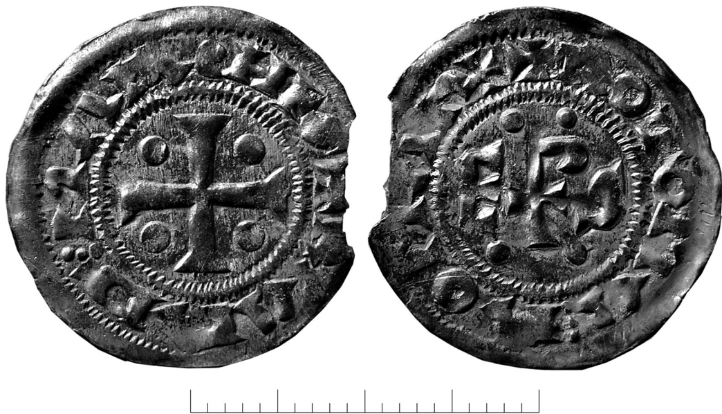
Рис. 3. Денарий нормандского герцога Ричарда I из клада Скёггс, аверс и реверс, Готланд, Швеция (SHM 7353).