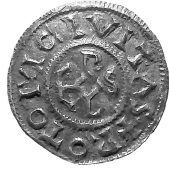
MOESGAARD, A TENTH-CENTURY HOARD OF COINS (1)