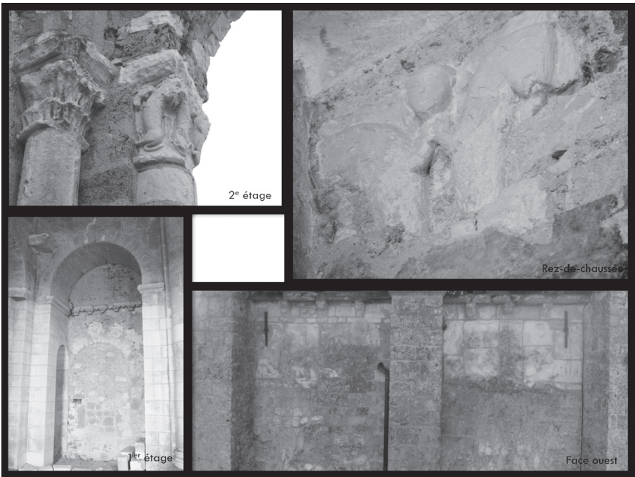
Fig. 8. Chapiteaux, frises et corniche de la tour Saint-Paul de Cormery.