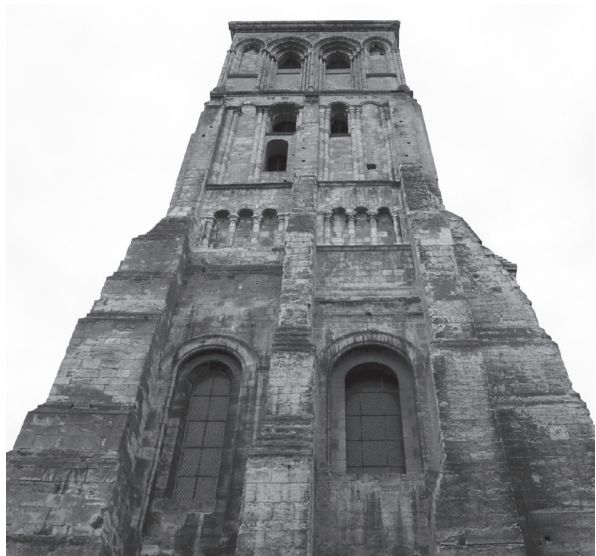
Fig. 2. La tour Charlemagne de la basilique Saint-Martin de Tours.