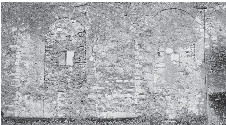
Fig. 5. Baies de la façade de l'église accolées à la tour Saint-Paul de Cormery.