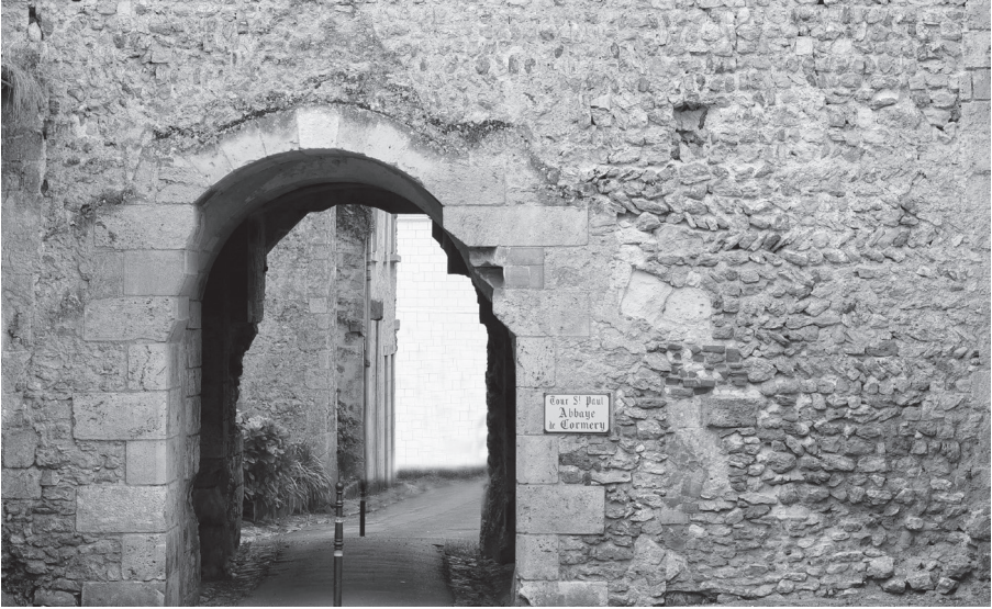
Fig. 7. Partie inférieure de la façade est de la tour Saint-Paul de Cormery. Mur antérieur au XI e siècle.