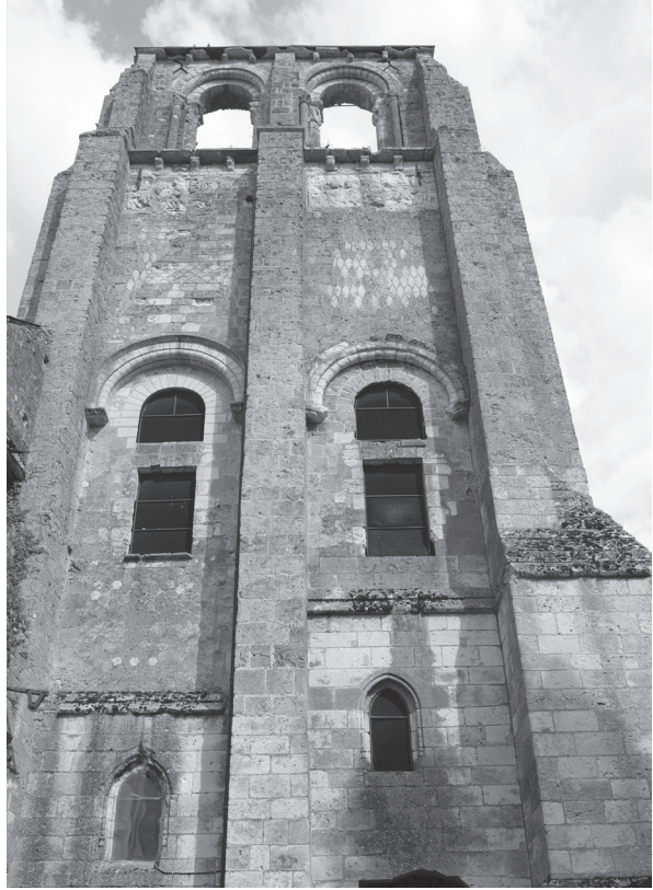
Fig. 1. La tour Saint-Paul du monastère de Cormery.