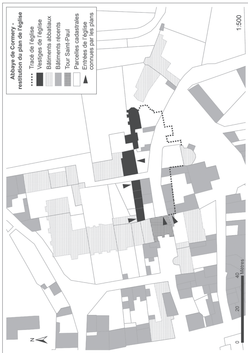
Fig. 3. Localisation des vestiges de l'église et des bâtiments conventuels de l'abbaye de Cormery.