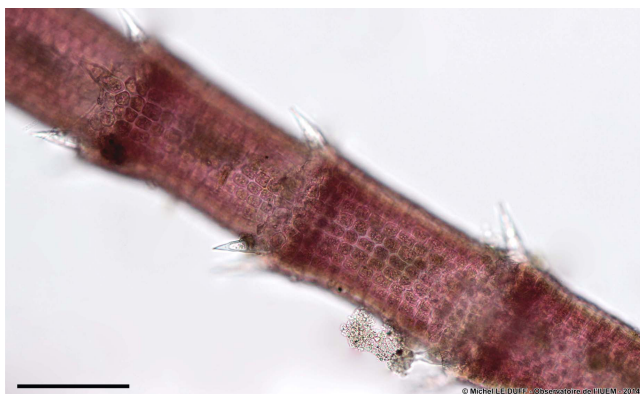
Figure 4 : Détail d'un axe de Centroceras clavulatum montrant la cortication régulière et les verticilles d'épines. Barre d'échelle = 100 µm.

En coupe transversale, les axes montrent de nombreuses cellules péricentrales de forme régulière (figure 5).