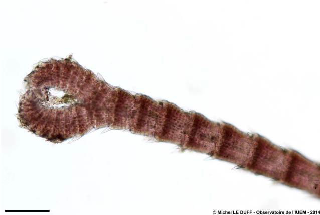
Figure 2 : Axe et terminaison apicale de Centroceras clavulatum à faible grossissement. Barre d'échelle = 200 \mu\text{m} .

et 3). Par contre, ils présentent aussi une cortication régulière formée de files de petites cellules rectangulaires que l'on ne retrouve pas chez ce genre.