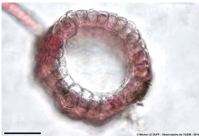
Figure 5 : Coupe transversale d'un axe principal de Centroceras clavulatum montrant un espace central correspondant à la file de cellules axiales (cladomiennes) et les péricentrales (cellules basales pleuriennes fusionnées en manchon). Barre d'échelle = 100 µm.

En coupe transversale, les axes montrent de nombreuses cellules péricentrales de forme régulière (figure 5).