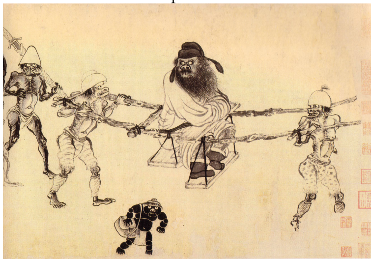
4. Gong Kai (vers 1222-1304), Zhong Kui donne sa sœur en mariage , Washington, Freer Gallery of Art, détail.

L'auteur de la seconde peinture éponyme (ill. 4), réalisée au plus tard avant 1403, Gong Kai (vers 1222-1304), fut un petit fonctionnaire sous les Song du Sud qui refusa de servir les Mongols, fondateurs de la dynastie des Yuan qui avait renversé les Song. Aussi Gong Kai vécut-il de son art plutôt que de prêter allégeance à un pouvoir qu'il jugeait illégitime. La peinture, sur papier, montre également la procession conduisant la sœur de Zhong Kui au mariage. Dans les deux œuvres, des tambours accompagnent la procession. Le détail sur le personnage de Zhong Kui laisse apparaître la hideur du personnage, aussi repoussant que les démons qui l'accompagnent, et assis sur une chaise à porteurs.