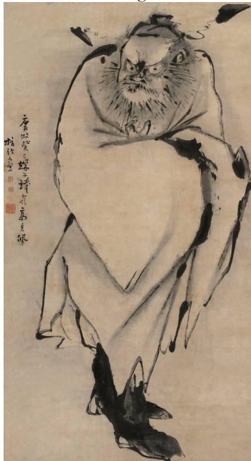
14. Gao Qipei (1660-1734), Zhong Kui l'exorciste , 122 x 63 cm, encre sur papier, vers 1726, Shenyang, musée du Liaoning. L'inscription indique :

Quelques dizaines d'années plus tard, le peintre Gao Qipei (1660-1734), contrairement à Shitao, n'a pas besoin de vivre de son art puisqu'il est fonctionnaire. Dès sa jeunesse, il veut créer son propre style et « invente » - plus exactement, il s'approprie une technique déjà existante mais peu usitée – la technique de la peinture aux doigts, employant le côté des doigts pour les aplats et les ongles pour les traits. Ce Zhong Kui l'exorciste (ill. 14) a été réalisé avec les doigts, sans le medium du pinceau, sur papier, pour la fête du Double Cinq, et l'inscription qui l'accompagne fait clairement référence à son origine sous les Tang. Nul démon ni chauve-souris, nulle épée ni tablette officielle n'apparaissent sur le rouleau. Pourtant, le personnage, debout, est immédiatement reconnaissable par sa laideur et sa barbe hirsute. Gao Qipei a peint un nombre considérable de Zhong Kui, dont beaucoup sont conservés au musée du Liaoning, à Shenyang. La ville de Tieling mentionnée dans l'inscription est située dans le Liaoning, province d'où sa famille était originaire 22 .