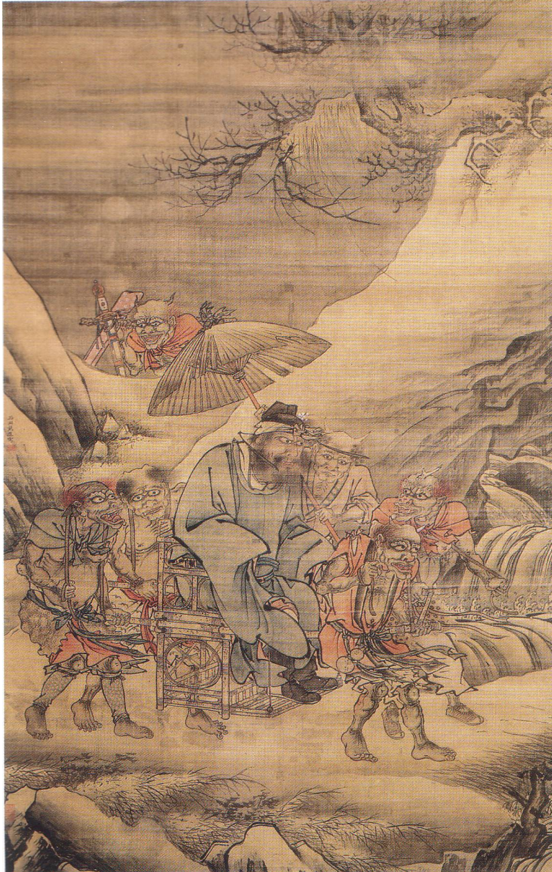
11. Dai Jin (1388-1462), Zhong Kui voyage la nuit , encre et couleurs sur soie, 189,7 x 120,2 cm, Pékin, musée de l'Ancien palais.

de l'Académie impériale Dai Jin (1388-1462), Zhong Kui, assis sur une chaise à porteurs, est seulement vêtu d'une robe de lettré – bleue comme il se doit – et non rouge pour exprimer le faste, si aucune chauve-souris n'est présente, reste que l'exorciste est accompagné dans son excursion nocturne, simplement indiquée picturalement par la lune, de six démons. Les brumes coupant horizontalement les arbres ainsi que la fleur de prunus dans la coiffe de Zhong Kui indiquent que le rouleau a été réalisé à la veille du nouvel an, au fort de l'hiver. Cette peinture est contemporaine de la précédente (ill. 9).