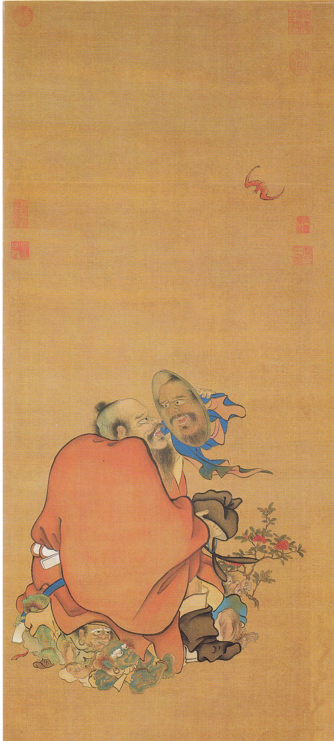
9. Anonyme des Ming, Présage d'abondance et de paix ( Fengsui xianzhaotu ), encre et couleurs sur soie, 128,2 x 49,3 cm, Taipei, musée national du Palais.

Pour illustrer ce dernier recyclage, il est utile de se faire une idée de ce qu'est une peinture de type professionnel, dont les lettrés tiennent à se distinguer. Il s'agit d'une œuvre anonyme, Présage d'abondance et de paix (ill. 9), avec un Zhong Kui en Yolaine Escande : « Recyclage, copie, transmission dans l'art chinois, à partir du cas de Zhong Kui », in Georges Roque et Luciano Chelles (éds.), numéro 23 de la revue Figures de l'art (Presses universitaires de Pau) sur L'Image recyclée , 2013, pp. 189-208, 16. ill. ISSN 1265-0692