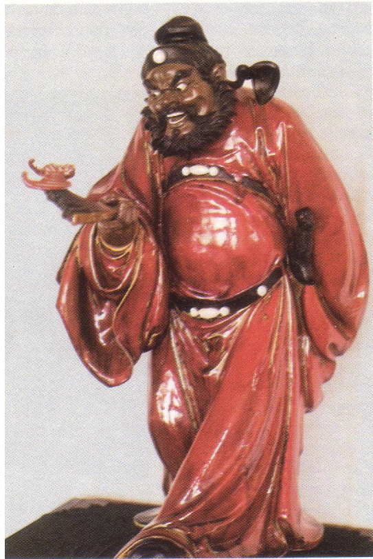
10. Zhong Kui en robe rouge, céramique, XX e siècle, ht. 30 cm, environs de Canton.

robe rouge. L'œuvre est réalisée sur soie, matériau noble et onéreux, qui fixe mieux les couleurs que le papier. Zhong Kui, habillé de rouge, couleur du sang et faste, tient un miroir, censé chasser les démons car leur image se reflète dedans et leur fait peur. Le miroir a un effet démonifuge depuis au moins la dynastie des Han (221 avant J.-C.-206 après J.-C.). Le personnage est assis sur trois petits démons qu'il soumet, dont un brandit une branche de grenadier en fleurs, indiquant que le rouleau a été peint en juin, pour la fête du Double-Cinq. L'efficacité de l'image, selon la tradition populaire chinoise, est accentuée par la redondance. Ce dont les lettrés vont tenter de se distinguer, tout en utilisant à leur profit le thème de Zhong Kui, tient aux marqueurs de la facture professionnelle, voire populaire : le support de soie, apanage de richesse et certainement résultat d'une commande à un professionnel, l'emploi des couleurs vives, ainsi que les attributs redondants qui accompagnent le personnage. Par exemple, dans une céramique de facture populaire des environs de Canton, la couleur rouge et la chauve-souris sont nécessairement présentes, ainsi que la posture de Zhong Kui à la jambe relevée (ill. 10).