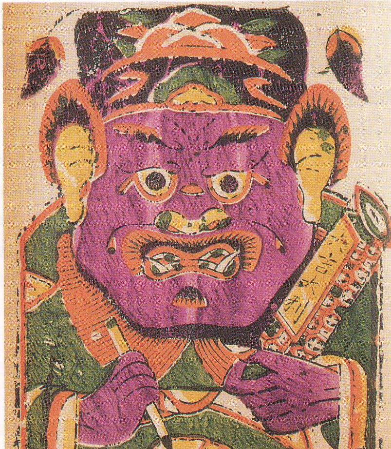
5. Tête de Zhong Kui, estampe de nouvel an colorée et présentant les attributs du lettré (tablette et pinceau) à placer sur la porte, fin du XIX e ou début du XX e siècle, 17 x 19 cm, Kaifeng, Henan, district de Zhuxian.

Zhong Kui est ainsi devenu un dieu protecteur, dont le portrait est peint au moment du nouvel an chinois, soit pour être collé sur la porte d'entrée de la maison afin de jouer le rôle d'un talisman protecteur (ill. 1, 5), soit pour être installé à l'intérieur de la maison, généralement face à la porte (ill. 11, 12, 13). Cependant, le motif de Zhong Kui est principalement apprécié au moment de la fête du Double Cinq (cinquième jour du cinquième mois lunaire), période d'apogée des épidémies dans l'année. Les festivités du Double Cinq ont pour but d'éloigner les calamités agricoles et autres maladies qui foisonnent à la chaude saison, et la figure de Zhong Kui est considérée comme particulièrement efficace. Le Zhong Kui représenté sur l'estampe du XX e siècle est clairement un exorciste ; on le voit accompagné de chauve-souris (ill. 6).