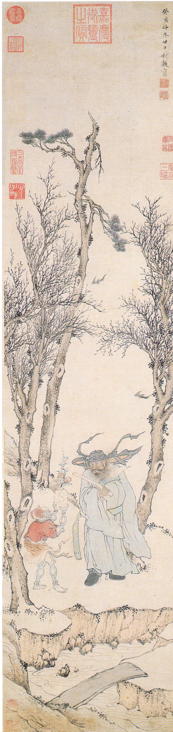
7. Qian Gu (1508-1578), Zhong Kui le Double Cinq (Wuri Zhong Kui) , encre et couleurs sur papier, 131 x 31,6 cm, Taipei, musée national du Palais

premières représentations de Zhong Kui accompagné d'une chauve-souris et tenant dans la main une tablette impériale au lieu du sabre.