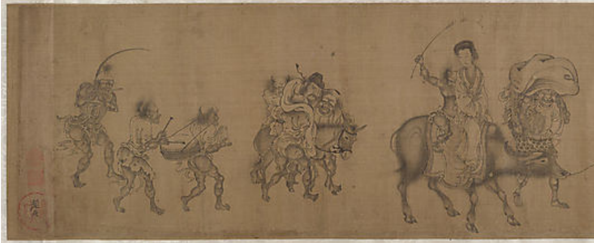
3. Yan Geng (actif vers la fin du XIII e siècle), Zhong Kui donne sa sœur en mariage ( Zhong Kui jia mei tu ), encre sur soie, 24,4 x 253,4 cm, New York, Metropolitan Museum of Art, détail.

que sa sœur a peine à faire avancer le buffle qu'elle chevauche, en brandissant une cravache.