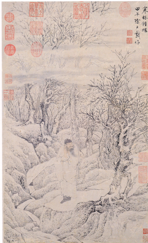
12. Wen Zhengming (1470-1559), Zhong Kui dans un bois hivernal (Hanlin Zhong Kui) , encre et couleurs pâles sur papier, 19,6 x 42,5 cm, daté 1534, Taïpei, musée national du Palais.

Par contraste avec l'interprétation populaire ou professionnelle, dans la peinture lettrée, le recyclage porte aussi bien sur le matériau pictural que sur l'interprétation du thème. Le papier est préféré à la soie ; Zhong Kui perd ses couleurs, c'est-à-dire qu'il est peint seulement à l'encre, et il devient un personnage assimilé au lettré, sans les autres démons et esprits. Il est moins effrayant et plus élégant, plus raffiné, plus policé. En revanche, sa laideur est généralement marquée. Par exemple, dans le rouleau vertical sur papier de Wen Zhengming (1470-1559), dont l'inscription « Zhong Kui dans un bois hivernal, peint par jeu, le dernier jour de l'année Jiawu [février 1534] », lui donne son titre, Zhong Kui est simplement debout, les bras croisés, une tablette officielle dans la main droite dépassant de sa manche (ill. 12). L'auteur l'a donc réalisé au moment de la fête du nouvel an. Le sabre habituel du personnage, qui était censé s'entraîner aux arts martiaux dans les forêts, est remplacé par la tablette du lettré. Comme dans le rouleau de Dai Jin, les brumes hivernales traversent les arbres afin d'accentuer l'effet de froideur.