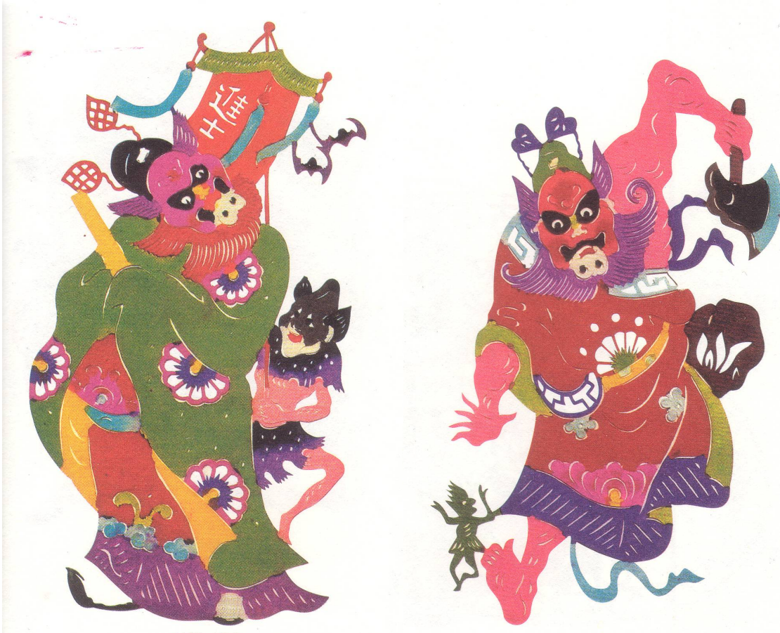
8. Paire de Zhong Kui, papiers découpés très colorés, Hebei, district de Wei, 2006.

Face à lui, un démon lui présente un vase ( ping , homophone de « paix ») avec des grenades et une branche feuillue, ce qui signifie traditionnellement « meilleurs vœux de bonheur ». Dans la partie supérieure du rouleau, on voit deux chauves-souris qui semblent voler vers le bas. Depuis les Han, les « chauve-souris », mot qui se prononce comme « bonheur », fu , se trouvent dans les représentations et symbolisent le bonheur ; or, peindre deux chauves-souris « descendant du ciel » signifie que Zhong Kui accueille le bonheur venu du ciel. La première mention écrite de ce thème se trouve dans un catalogue des peintures conservées dans la collection impériale des Ming, qui rapporte le titre d'un rouleau, Zhong Kui accueille la chauve-souris , daté de 1481. Le contenu pictural étant identique à celui de Qian Gu, cette dernière peinture est nécessairement une copie de la précédente 20 .