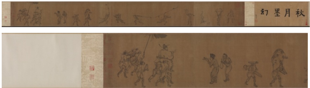
2. Yan Hui (actif vers 1250-vers 1300), Excursion nocturne aux lanternes de Zhong Kui , encre et couleurs sur soie, 25,70 x 904,40 cm, Cleveland Museum of Art, et détail.

montre Zhong Kui en lettré exorciste et pourfendeur de démons la nuit au moment du nouvel an 18 .