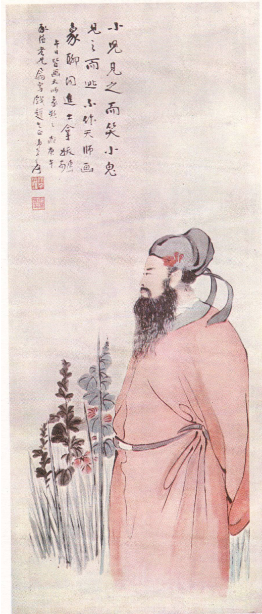
15. Zhang Daqian (1898-1983), Zhong Kui , encre et couleurs sur papier, 150 x 58,8 cm, 1930, coll. particulière.

Enfin, beaucoup plus près de nous, l'artiste considéré comme le plus grand peintre chinois du XX e siècle, Zhang Daqian (1898-1983) a réinterprété la figure de Zhong Kui (ill. 15) en se représentant lui-même sous les traits de l'exorciste, ce qui était jusque là inédit. Shitao comme Zhang Daqian savaient fort bien que le maître de la peinture chinoise, Wu Daozi, avait vu son Zhong Kui reconnu par la postérité. Shitao, se rendant en ville, avait besoin de reconnaissance, et le choix de ce thème courant, à la fois populaire et lettré, ouvrait à un public d'emblée large. Quant à Zhang Daqian, il présentait cette œuvre à un concours, alors qu'il était tout jeune (à 32 ans).