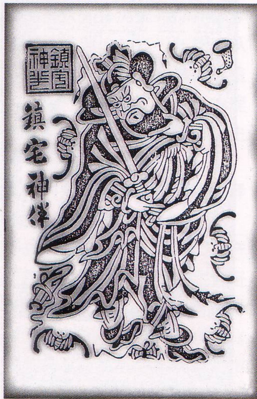
6. Zhong Kui l'exorciste ( Zhenzhai shenban ), estampe pour la fête du Double Cinq, Shaanxi, district de Fengxiang.

La chauve-souris apparaît au moins au XVI e siècle, comme en atteste la peinture du lettré Qian Gu (1508-1572), ami du célèbre Wen Zhengming (1470-1559), réalisée à l'occasion de la fête du Double Cinq : Zhong Kui lors du Double Cinq ( Wuri Zhong Kui ) (ill. 7). L'intérêt de cette peinture tient à ce qu'elle montre une des