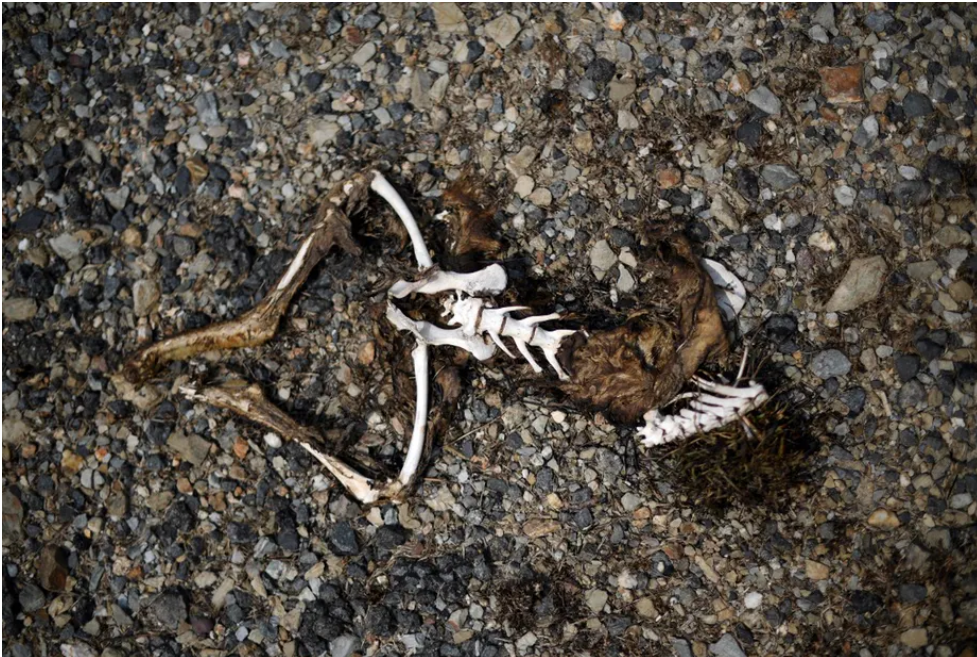
Une carcasse de kangourou, le 8 janvier 2020 dans l'État de Nouvelle-Galles du Sud.

Le développement des incendies en Australie, tout particulièrement dans l'État de Nouvelle-Galles du Sud, est dramatique. Ces feux affectent plus de 3 millions d'hectares de milieux naturels variés (savanes, forêts sèches, forêts humides) – soit plus que la surface de la Belgique.