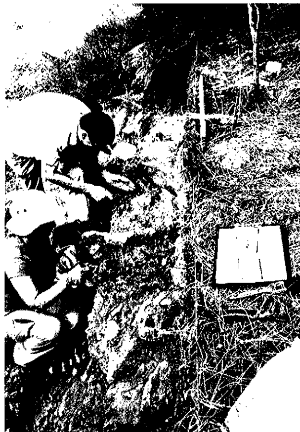
Figure 1 : Rectification de coupe et mise au jour des vestiges solutréens et magdaléniens conservés à la base du versant du site des Roches d'Abilly.

À la base du versant, où nous avons mis au jour un niveau archéologique dense (fig. 1), constitué d'éclats de façonnage de feuilles de laurier, dont certaines de très grande taille, comme celles produites aux Maîtreaux, qui devaient dépasser 30 cm. Ces restes taillés sont associés à une production laminaire que l'opération de fouille de 2008 a permis de mieux caractériser. Nous pensons qu'elle est, en partie, attribuable à un autre passage sur le site, probablement pendant le Magdalénien supérieur. Des remontages de vestiges issus d'un même mètre carré, et les observations de l'organisation spatiale des objets des dépôts sédimentaires vont à l'encontre de l'hypothèse de la mise en place par glissement de terrain, de vestiges d'occupation situés plus haut sur le versant, mais à faible distance de son emplacement actuel. Ils correspondraient bien à des restes de taille et des outils