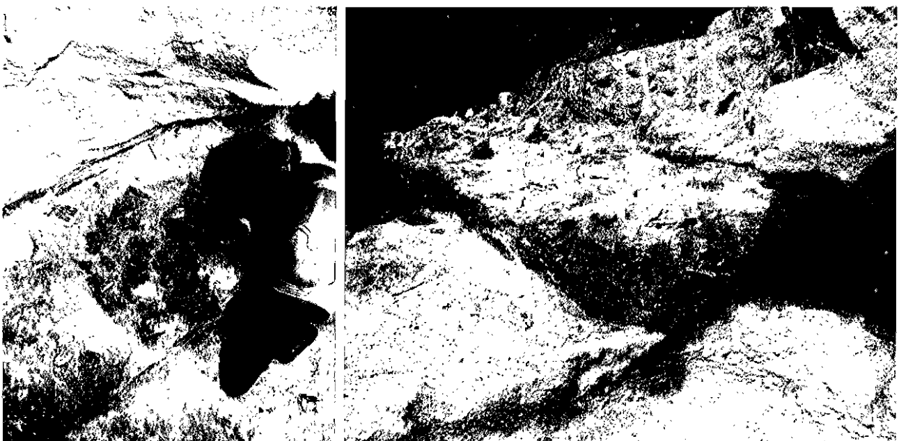
Figure 3 : Strates 4 à 1 qui sont scellées sous une dalle d'effondrement du toit de l'abri Bordes-Fitte.

Une incisive latérale droite supérieure, permanente, dont la couronne et la racine étaient complètement formées, premier reste humain paléolithique de la vallée de la Claise, a été découverte à la base de la strate 3.