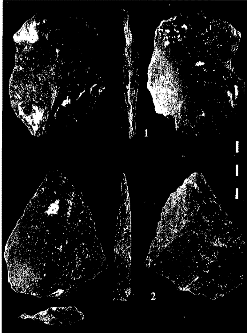
Figure 4 : Éclats levallois conservés dans la strate la plus ancienne de la séquence stratigraphique de l'abri Bordes-Fitte.

Ces nouvelles données fournissent un contexte stratigraphique aux différentes phases d'occupations humaines et une explication au caractère aberrant de la série si l'on acceptait son attribution en bloc au Solutréen, noté par Bordes, Fitte et d'autres auteurs (Despriée et Duvialard, 1995, Marquet, 1999), en apportant des éléments objectifs pour montrer que l'outillage présenté, regroupait en fait plusieurs composantes stratigraphiques et culturelles.