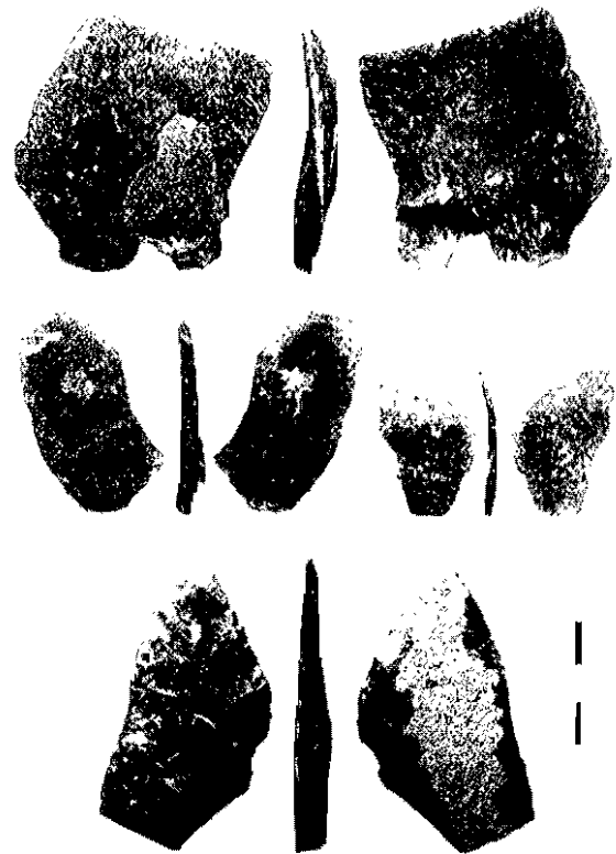
Figure 2 : Éclats de façonnage et fragment de feuille de laurier solutréenne, trouvés lors de la reprise des fouilles en limite de l'abri Bordes-Fitte.

Les restes osseux de rongeurs livrés par les deux campagnes de fouilles de 2007 et 2008 sont rares. Les espèces découvertes semblent montrer cependant le caractère très froid et très sec du climat depuis la strate 2 jusqu'à la base de la strate 4. Le plateau était probablement presque dépourvu d'arbres, soumis aux vents très froids de l'hiver (Campagnols des hauteurs et des champs), les vallées mieux protégées présentant des zones plus humides (Campagnol nordique et Lemming à collier). Les refus de tamis ont aussi livré des restes du crapaud calamite