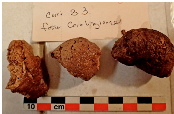
Fig. 1 : Coprolithes de la rue Dinet. Les éléments analysés sont situés à gauche et à droite de la photo. Leur couleur brun rouge pourrait indiquer une action modérée de la chaleur.

On peut remarquer la présence de fragments osseux dans le fragment, à gauche (fig.1).