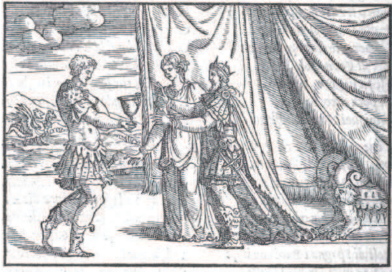
Illustration 1. Ludovico Dolce, Le Trasformazioni di messer Ludovico Dolce , Livre VII, Venise, Giolito de' Ferrari, 1553. ( http://ovid.lib.virginia.edu/MetDolce1553/LD155354.jpg )

Le graveur consacre un véritable cycle au héros, ainsi devenu visible : pas moins de quatre gravures. Après avoir été diffusé dans les nombreuses reprises de cette édition, le bois sera imité dans l' Ovidio Politico Istorico Morale de Francesco Bardi, paru en 1674, 1688 et 1696 40 . Cet ouvrage se présente comme une suite d'emblèmes ovidiens, tirant de chaque épisode, évoqué conjointement par une gravure et un résumé en prose, une leçon politique et/ou morale. Or l'argument et l'allégorie adjoints à l'épisode mettent l'accent sur le personnage de Médée :