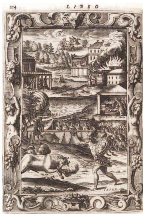
Illustration 2. Le Metamorfosi di Ovidio, ridotte da Giovanni Andrea dell'Anguillara in ottava rima , gravure-sommaire du Livre VII, Venise, B. Giunti, 1584, gravure de Giacomo Franco. ( http://ovid.lib.virginia.edu/vaam1584/large/pg214P4.html )

L'allégorie propose au lecteur de voir ici une « Figura di quelli, che sotto finta amicitia machinano tradimenti ». En 1676, Bardi ajoute : « Non vi è animale come amoroso, così più vindicativo della donna. » La reconnaissance de Thésée par son père devient l'exemple d'une fourberie déjouée, et la figure saillante est celle, maléfique, de la traîtresse. Thésée apparaît aussi, de manière très discrète, dans la traduction d'Andrea dell'Anguillara illustrée par Giacomo Franco (1584 42 ) (III. 2) et dans ses imitations lointaines pour la traduction anglaise de George Sandys, illustrée par Klein et Savery (III. 3) 43 . Les gravures se constituent en sommaires visuels, elles répartissent dans la perspective la succession des épisodes de chaque livre. La reconnaissance de Thésée, figurée tout à fait en arrière-fond, n'est pas un sujet saillant.