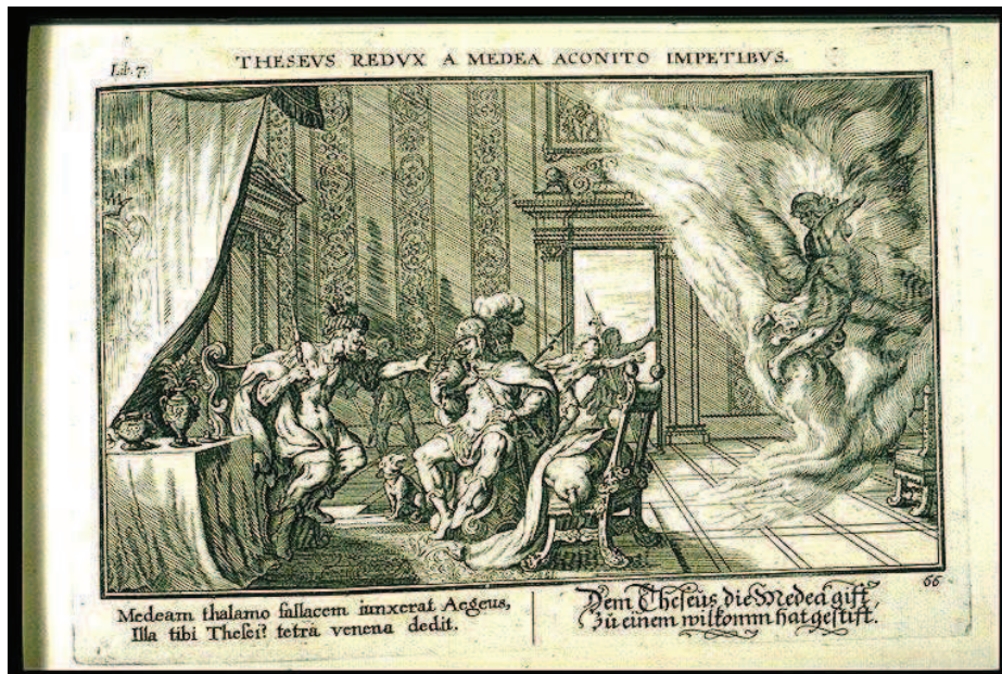
Illustration 5. Johan Wilhelm Baur, Ovidii Metamorphosis , Vienne, s.n., 1641. ( http://www.uvm.edu/~hag/ovid/baur1703/baur1703b7p66.jpeg )

proposée par Jean Lepautre renchérit encore en posant au premier plan des rideaux qui forment une sorte de cadre de scène 46 .