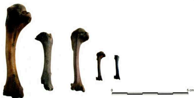
Fig. 140. Humérus d'oiseaux. De gauche à droite : poule, pigeon, geai, bouvreuil, pinson